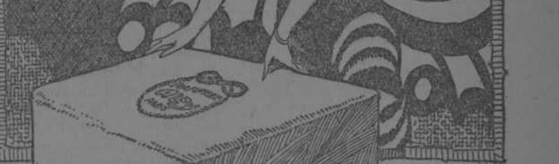
Perfumería Nady PARIS

En la última vez: el almanaque del estante mostraba siempre ser de enero, ¡ay! tan lindo, tan simpático, y ya pasado. Ahora mismo las ramas floridas de los rosales de un ventanillo entran como a buscar, y tiemblan al abrazarse y decirse: ¿cómo volverás?