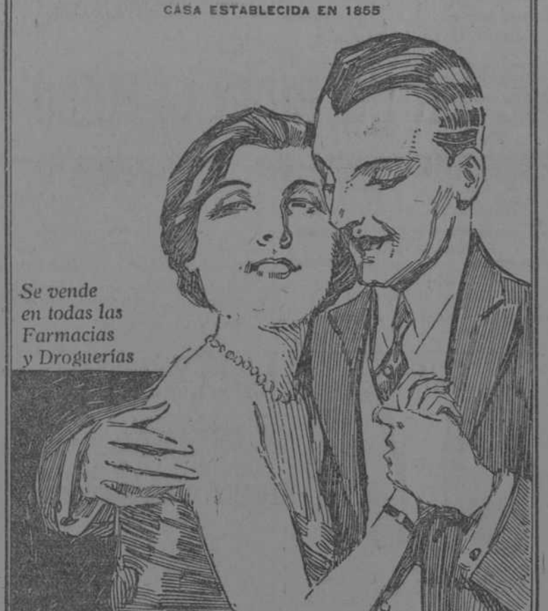
Se vende en todas las Farmacias y Droguerías

PREPARADO POR Frederick Stearns & Co., Detroit, E. U. A. CASA ESTABLECIDA EN 1865