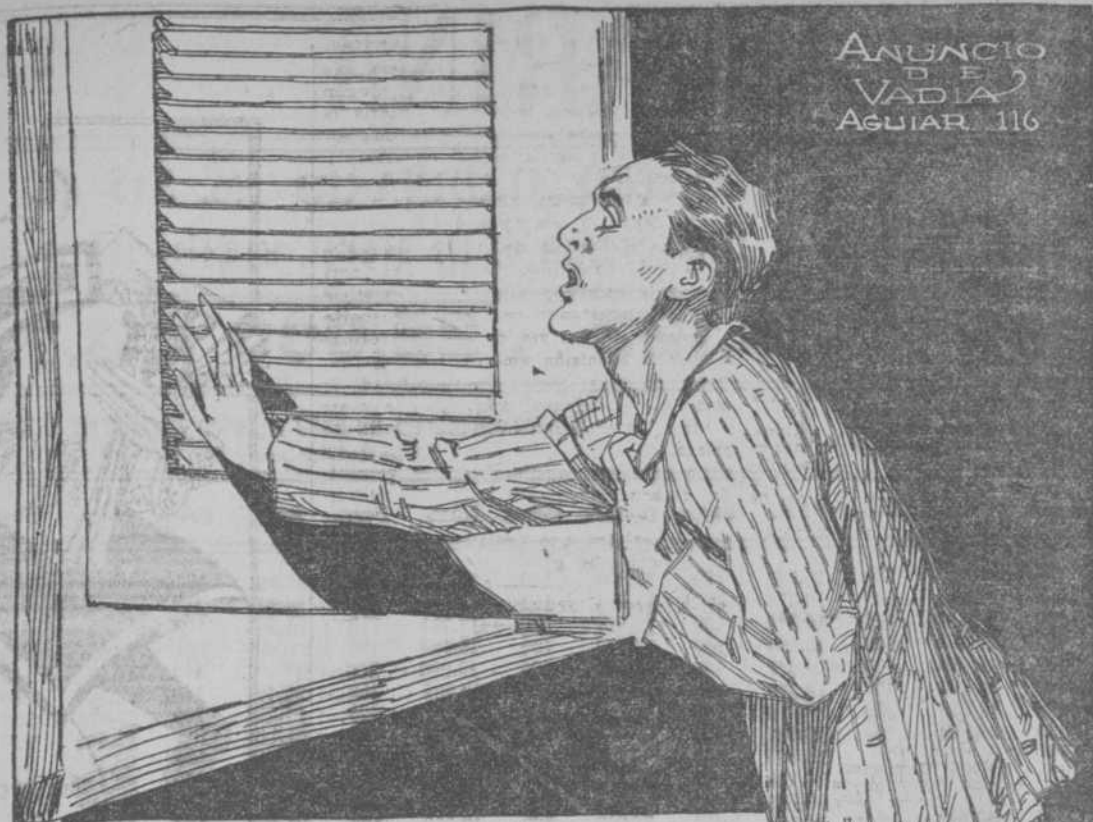
ANUNCIO DE VADIA AGUIAR 116