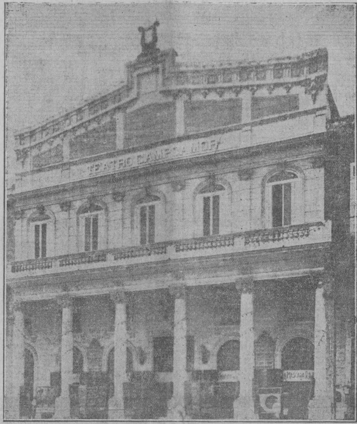
LA REAPERTURA DEL TEATRO CAMPOAMOR