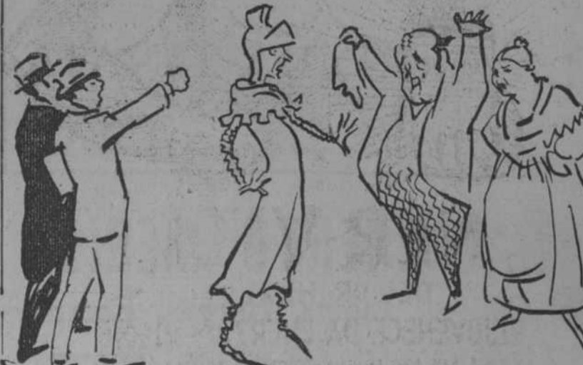
La obra toca ya a su fin y es la figura más tónica la fiébil merluza atónica que quiere hacer el Lohengrin.