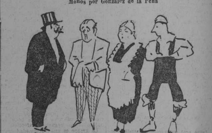
Carballido en el café ha descubierto a tenor, y dice: Con este haré yo un negocio al por mayor.