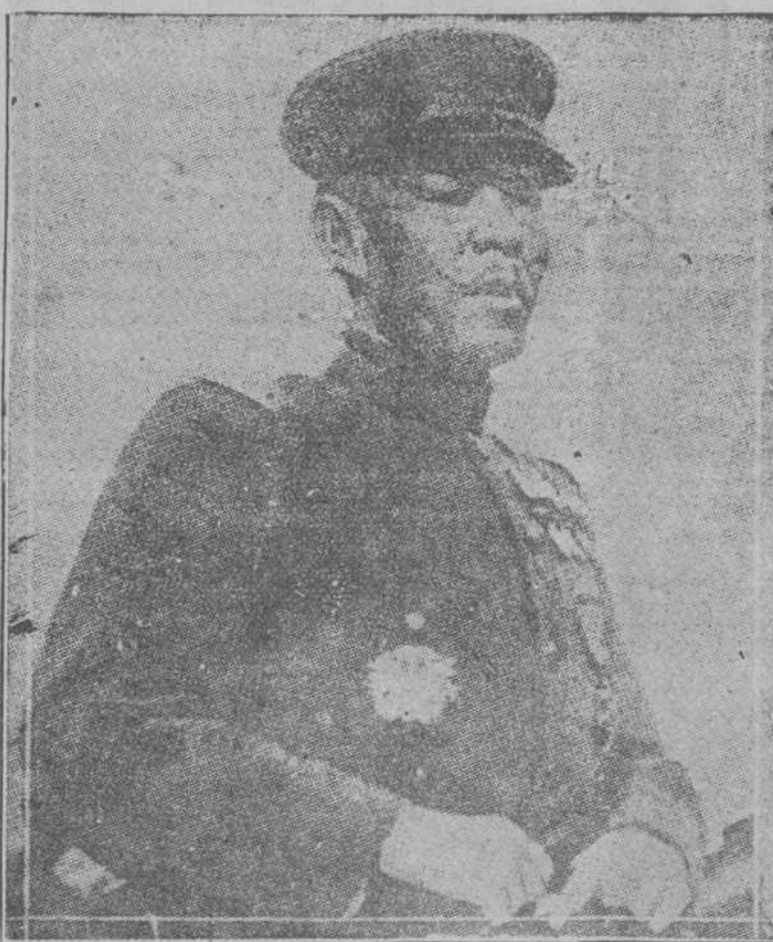
General japonés Kikuzo Otani que mandará la expedición de las fuerzas aliadas, norte-americanas japonesas y cesco-eslavas en Siberia

Agrupados alrededor de la bandera de libertad e independencia que nosotros, que somos todavía vuestros aliados, levantamos para vosotros y asegurad el triunfo de esos dos grandes principios sin los cuales no puede haber paz duradera, ni verdadera libertad en el mundo."