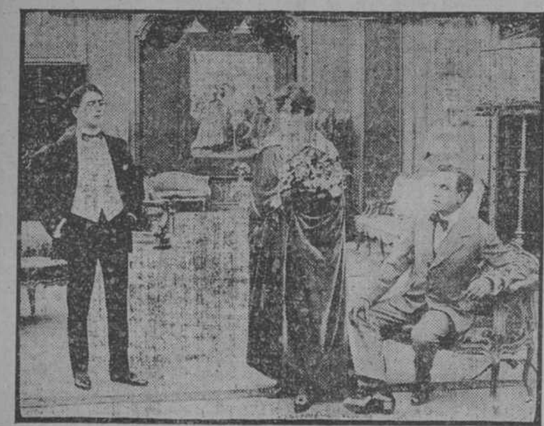
Una escena de la Película "El Límite de la Locura"

En breve La Regia Serie "Cristóbal Colón."