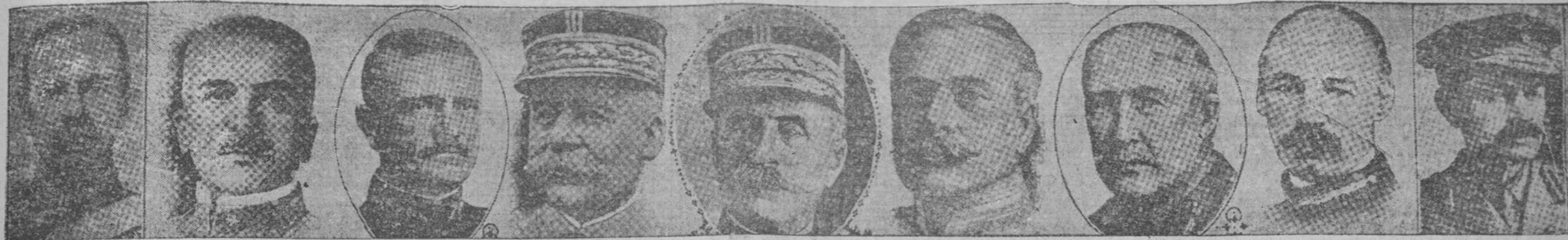
Sir Herbert Plumer.

GENERALES ALIADOS QUE MANDAN LAS FUERZAS EN FLANDES, FRANCIA E ITALIA.