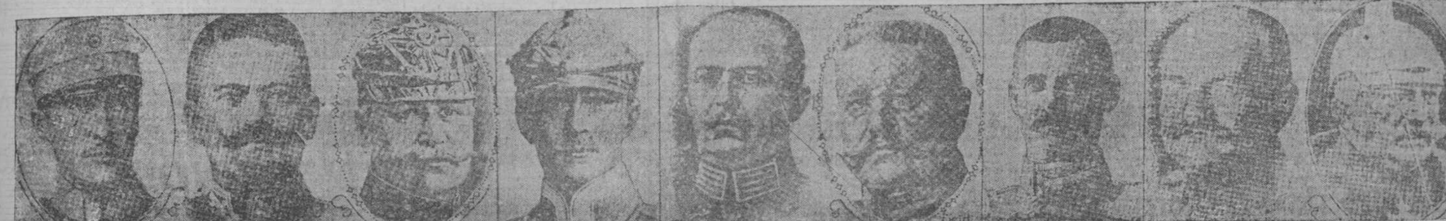
Duque Alberto de Wurtemberg.

GENERALES ALEMANES QUE MANDAN LAS TROPAS DE FLANDES Y FRANCIA.