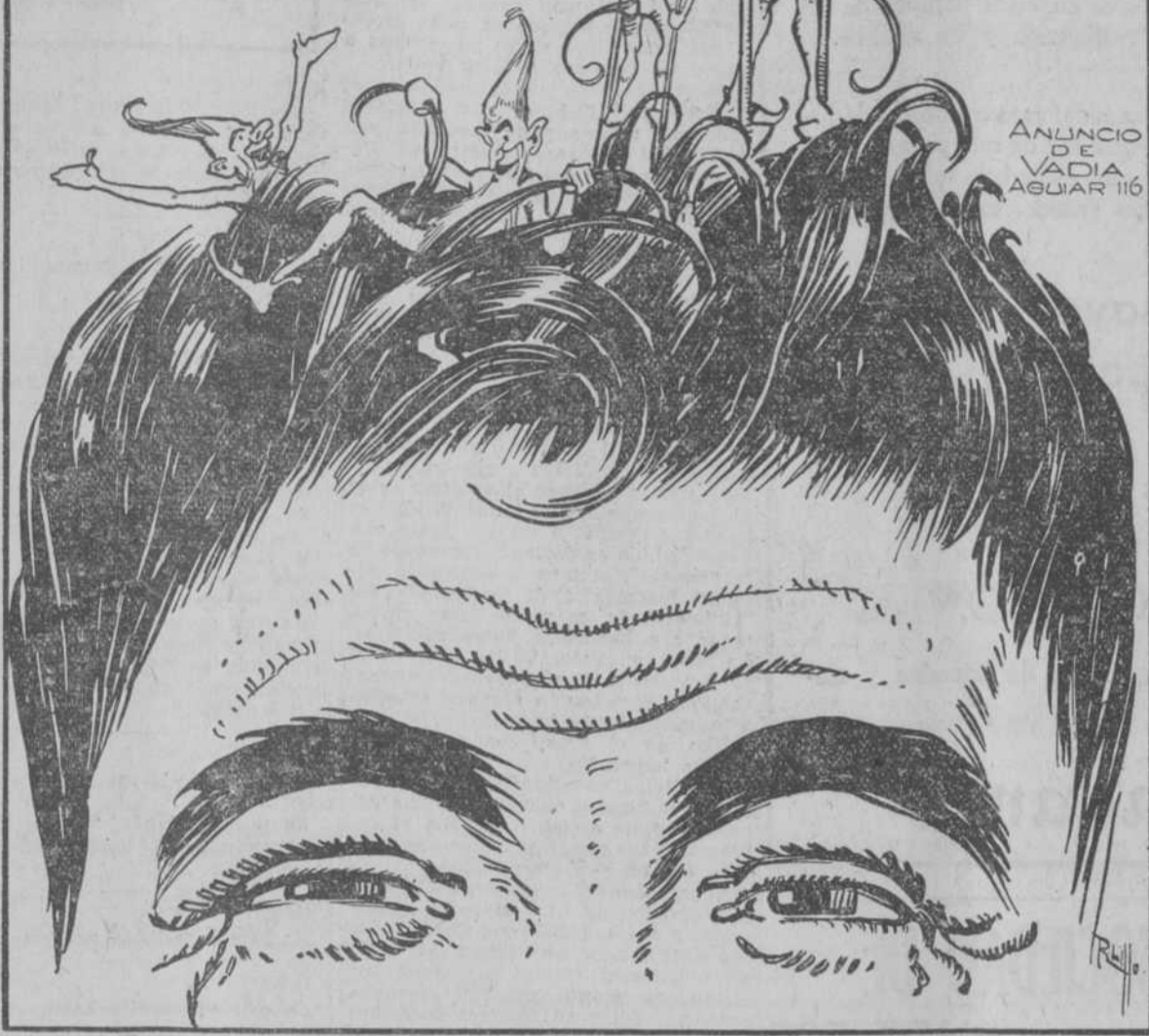
ANUNCIO DE VADIA AGUIAR 116

Destruye la Caspa. Perfuma Exquisitamente.