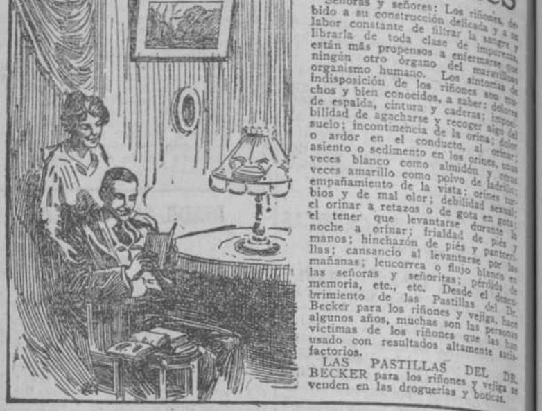
Señoras y señores: Los riñones, debido a su construcción delicada y a su constante filtración de sangre...