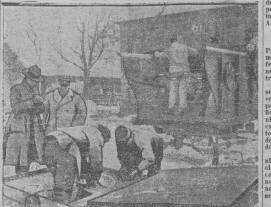
Un taller de reparación de máquinas agrícolas en la proximidad del frente.

Londres, Febrero 2 Los despachos de Berlín hablan de