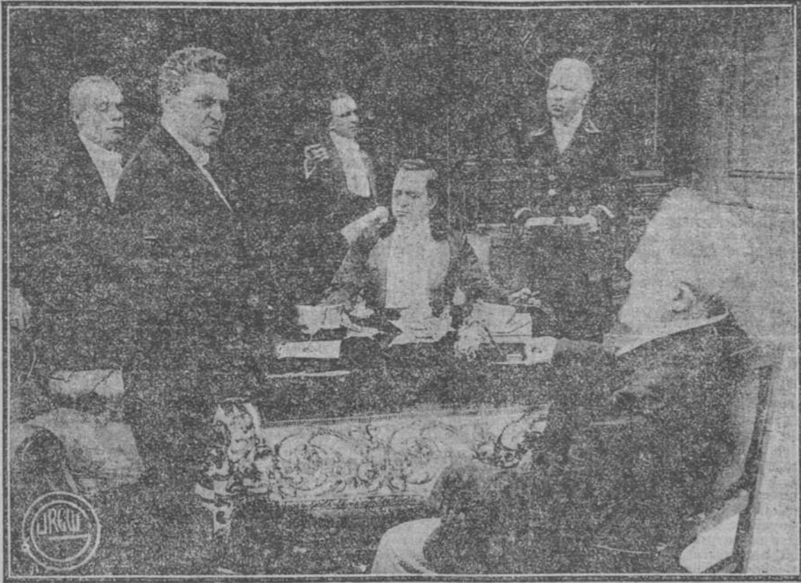
"El Club de los Reptiles" está secretamente constituido por un grupo de acudados financieros, cuyas conciencias sin escrúpulos hallan buenos todos los medios conducentes al logro de sus ambiciosas especulaciones.

Será estrenada por Santos y Artigas el Jueves, 31. Función de Moda