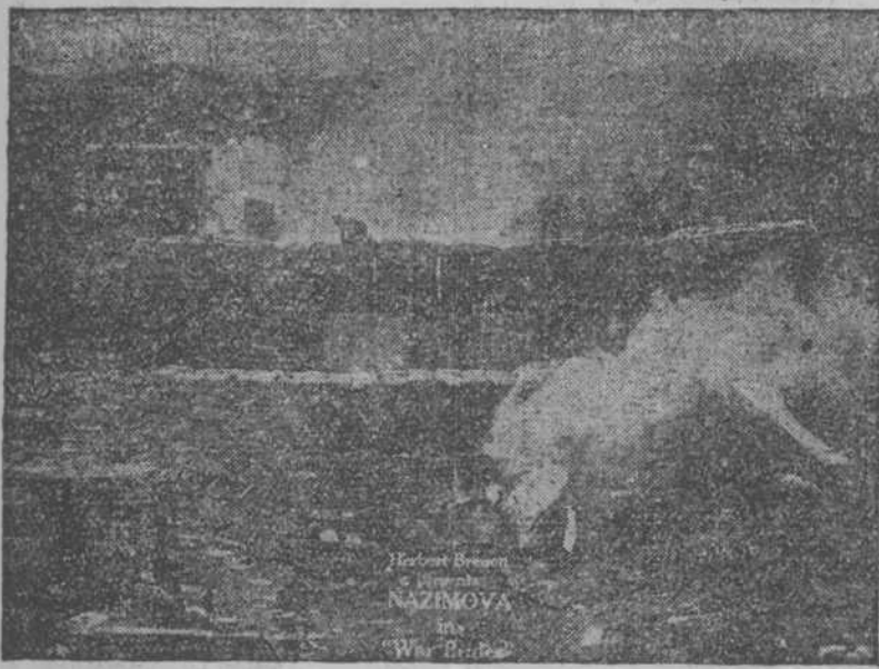
Una escena de REDENCION.

Canovas y Batalla, Aguacate, núm. 49. Habana.