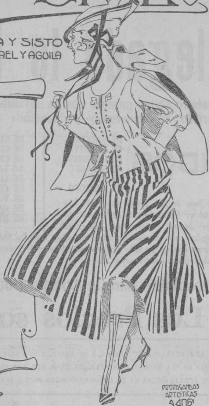
PROPAGANDA ARTISTAS 4061

"LA FLOR DE TIBES" IMPORTA directamente el MEJOR CAFE y por eso, los que saben saborear el divino néctar, no toman más café que el de "LA FLOR DE TIBES" Reina, 37. Teléfono A-3820.