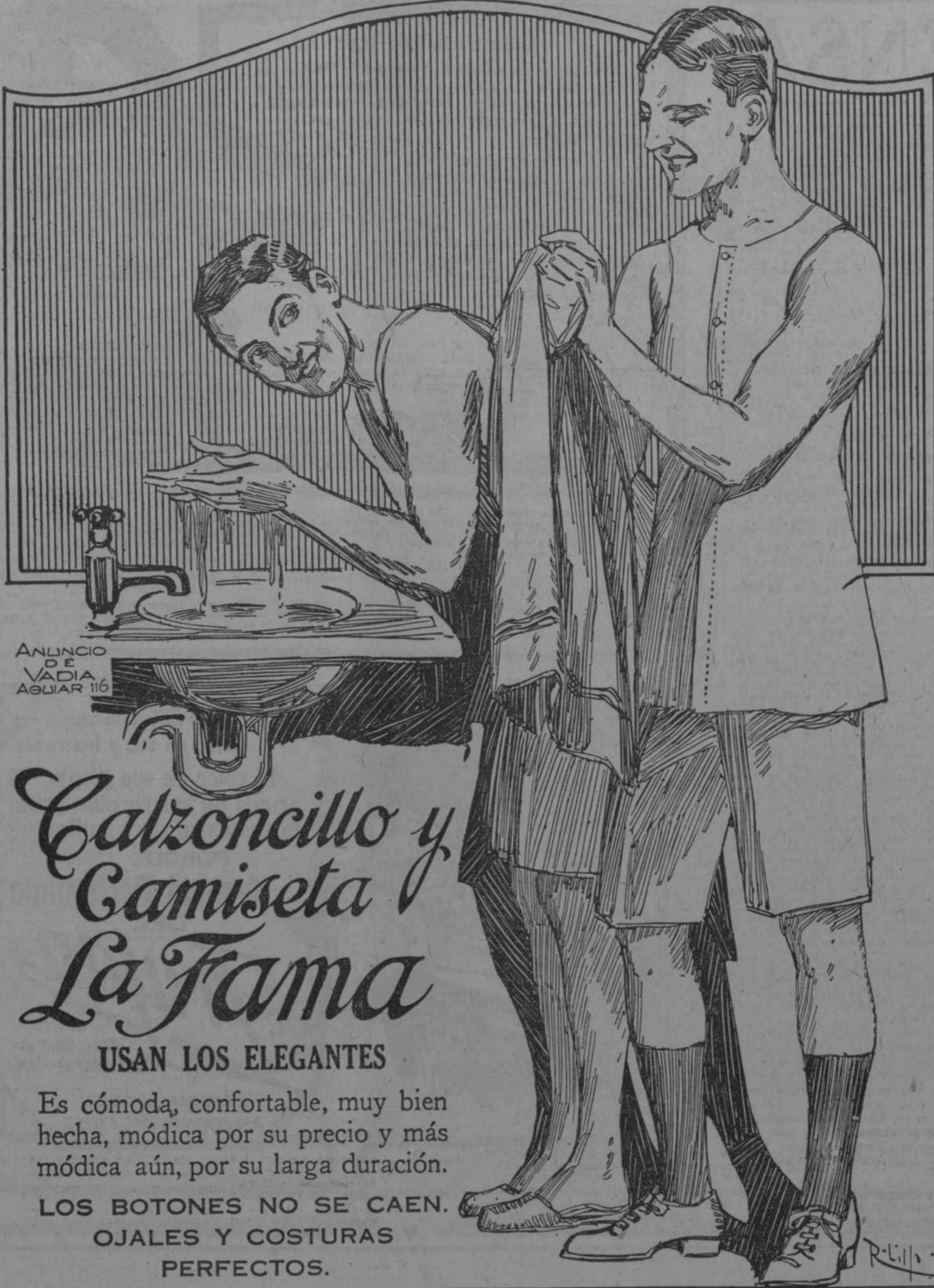
ANUNCIO DE VADIA AGUJAR 116

Queda pues solemnemente proclamado otra vez, por uno de los más conspicuos prohombres de Cuba, que los españoles de Cuba, esos a quienes los modernísimos cubanizadores llaman "gallegos," realizan una labor nacional española y nacional cubana contribuyendo al mismo tiempo y con la misma eficacia al progreso, a la cultura y al engrandecimiento de cubanos y españoles.