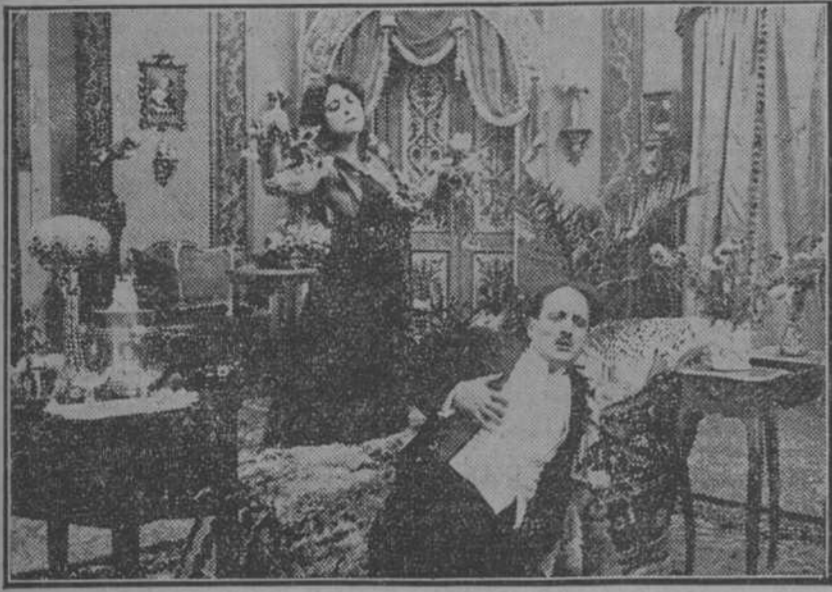
...Y el cielo quiso que el Regente expiara su gran culpa, gracias a la divina Merope...