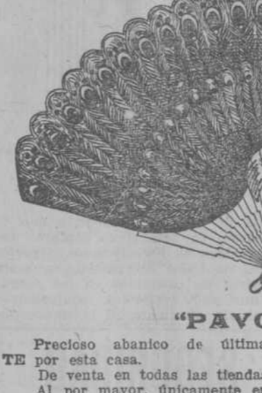
"PAVO REAL" Precioso abanico de última creación, recibido EXCLUSIVAMENTE por esta casa.

Lo hizo notar al ama de llaves que le acitista, la cual, a instancias del químico, tomó un pedazo del mismo pan y lo comió. Después de mastcarlo y saborearlo concienzudamente, la buena mujer aseguró que el pan le sabía lo mismo que siempre.