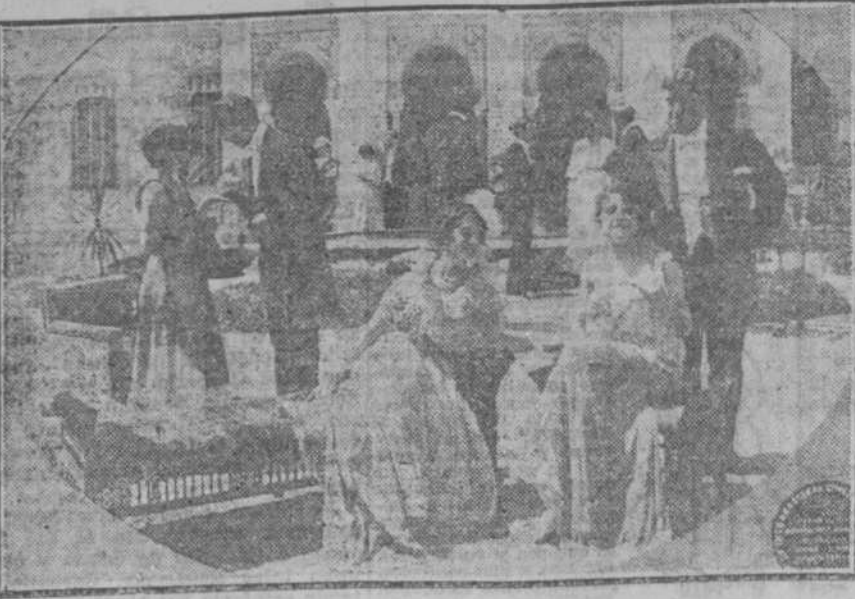
Y se interpone en el camino de la Condesa Mand, una rival, enamorada de su joven prometido...