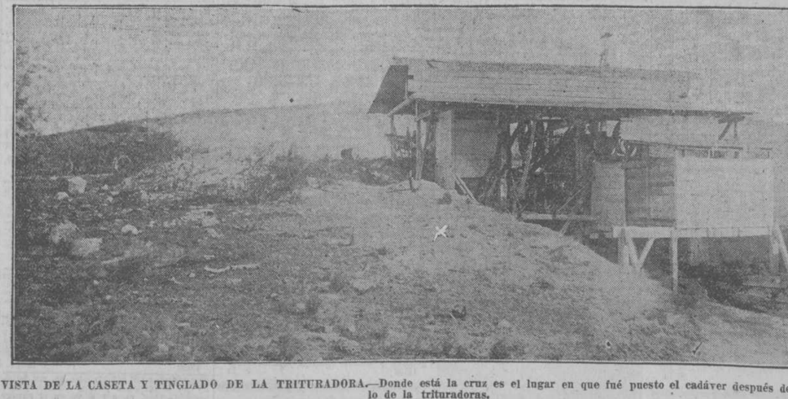
VISTA DE LA CASITA Y TINGLADO DE LA TRITURADORA.—Donde está la cruz es el lugar en que fué puesto el cadáver después de extraerlo de la trituradora.