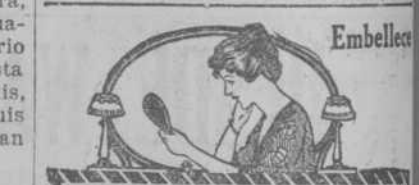
Embellece su rostro...

Si desea Ud. obtener información acerca de algún síntoma que tenga, escriba a Lydia E. Pinkham Medicine Co. de Lynn, Mass. y recibirá un buen consejo.