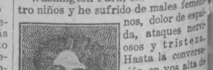
Lydia E. Pinkham y las Píldoras de Higado me devolvieron la salud...

Washington Park, Ill.—"Tengo cuatro niños y he sufrido de males femeninos, dolor de espalda, ataques nerviosos y tristezas..."