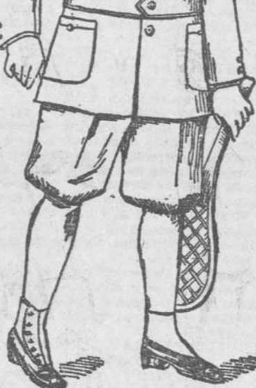
En blanco, crudo, acero y kaky de 8 a 14 años, 3 pesos. A los comerciantes del interior precios especiales, cambiando los colores y tallas que no se vendan.

16 DE ABRIL DE 1867 Editorial. La importación de oro. Reestablecido. El príncipe Imperial de Francia se halla completamente repuesto de su última enfermedad. Fallecimiento. En Guanabacoa ha dejado de existir el apreciable caballero don Gavetano Núñez de Villavicencio, y en esta ciudad las señoras doña Narcisca Castellanos viuda de Mediavilla y doña Gumersinda Roque de Garbalosa.