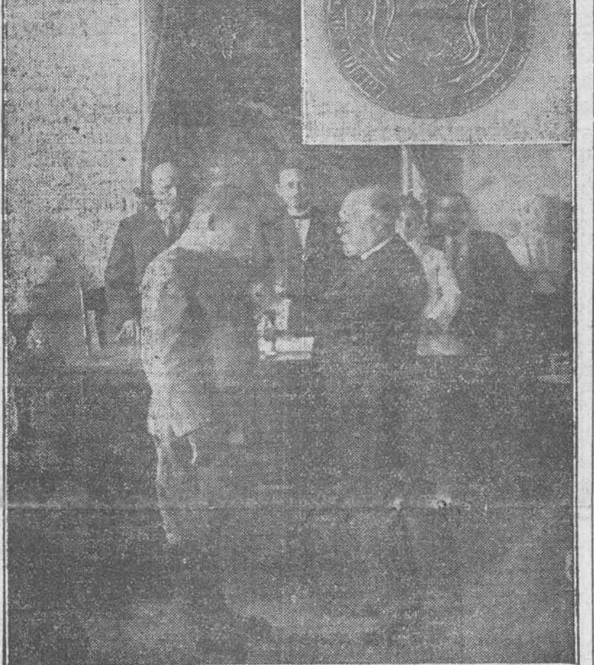
El Gobernador de Santa Clara, general Carrillo, colocando al Brigadier Conseguegra la medalla honorífica de su nombramiento de hijo predilecto de Villaclara.—Fotografía de la Medalla.