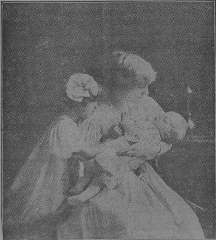
(MIMANDO AL CHIQUITIN)

UN BUEN CUADRO ES EL REGALO QUE MAS LUCE Y MAS SE AGRADECE