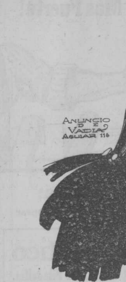
ANUNCIO DE VADIAZ AGUIAR 116

Frente del Mariscal Mackensen.—El enemigo fué arrojado por nuestro ejército de la Dobrudja a la esquina Noroeste de este país. La ribera septentrional del Danubio en ambos lados de Tulcea se encuentra bajo el fuego de nuestros cañones.