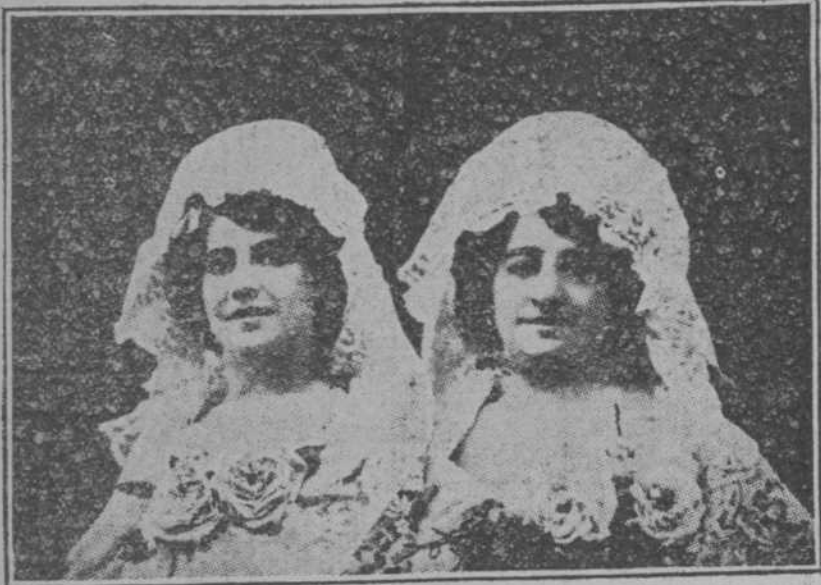
LAS HERMANAS CASTILLA