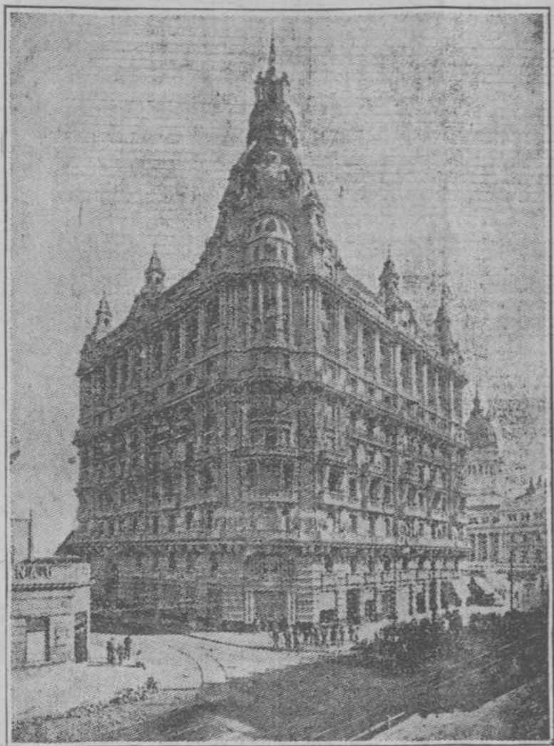
El edificio de la Asociación de Socorros Mutuos de Buenos Aires a la que hace referencia el señor Ortega Mullin en la correspondencia que con el título de "Un viaje a las tierras del Plata" hemos publicado en nuestra edición de la mañana de hoy.