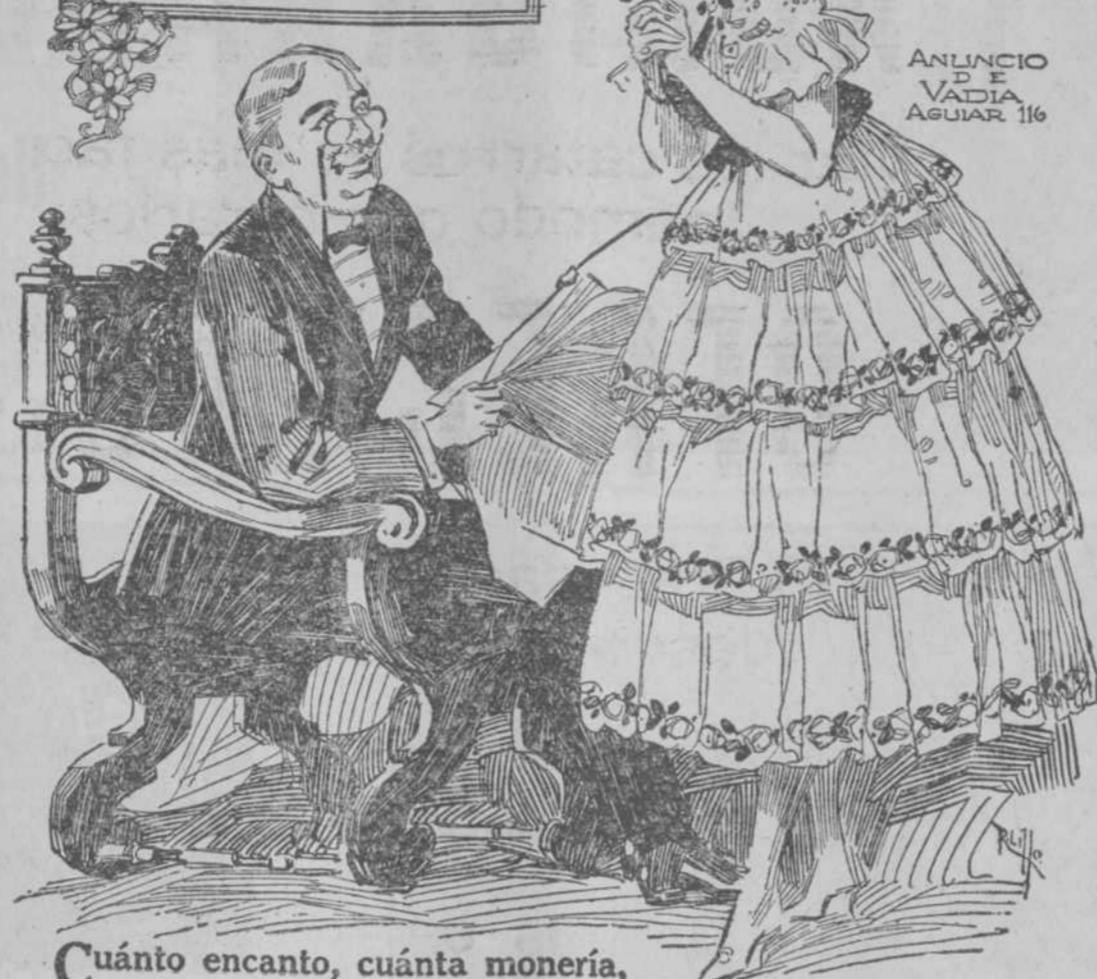
ANUNCIO DE VADIA AGUIAR 116