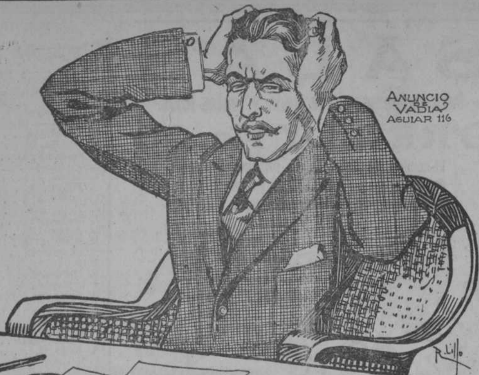
ANUNCIO VADIA AGUIAR 116