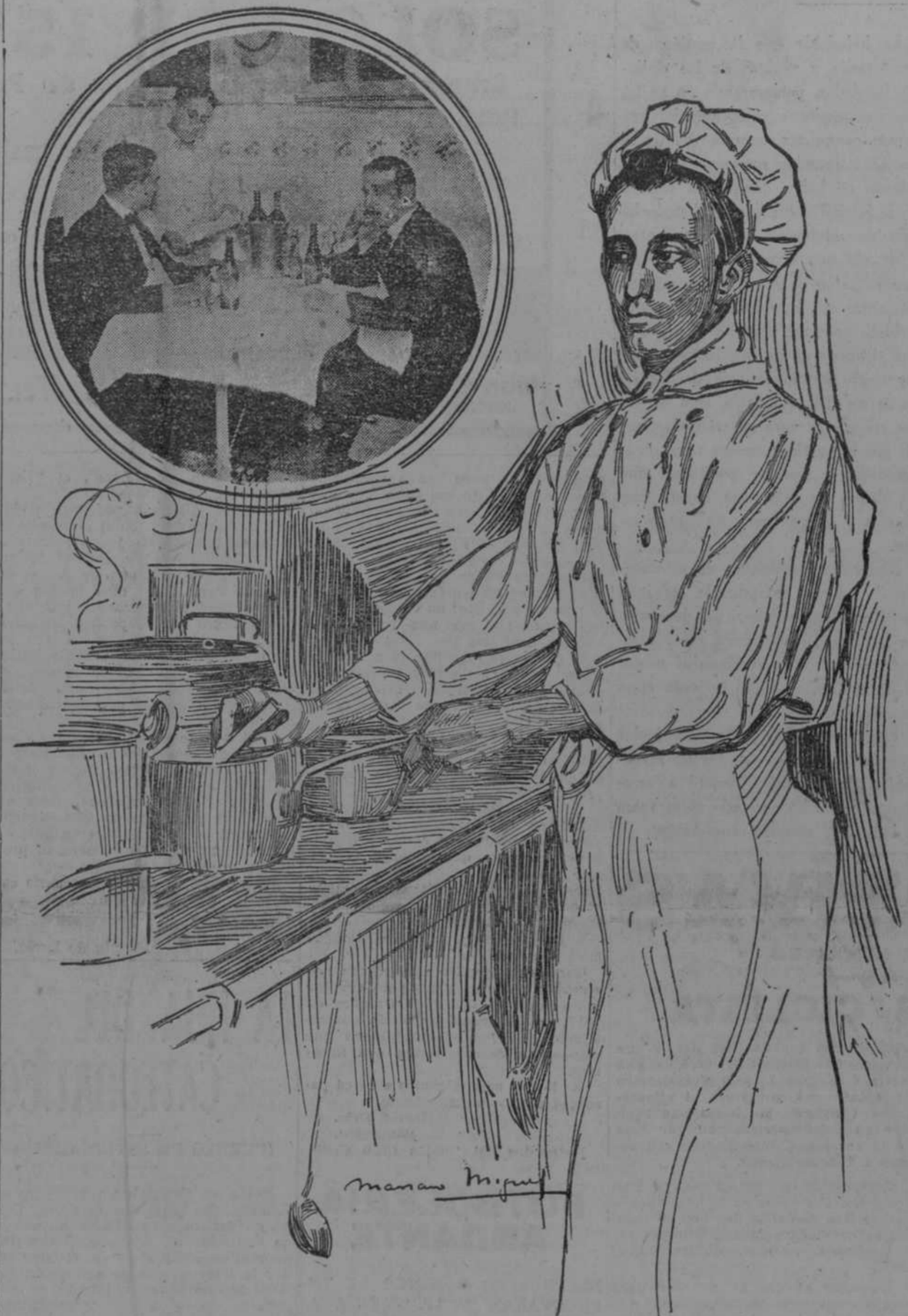
1o. Comiendo y observando.

Emblema de la Boleta Electoral: "Comunión Patriótica Radical", un indio con el lema: "Asbert; Patriotismo y Honor".