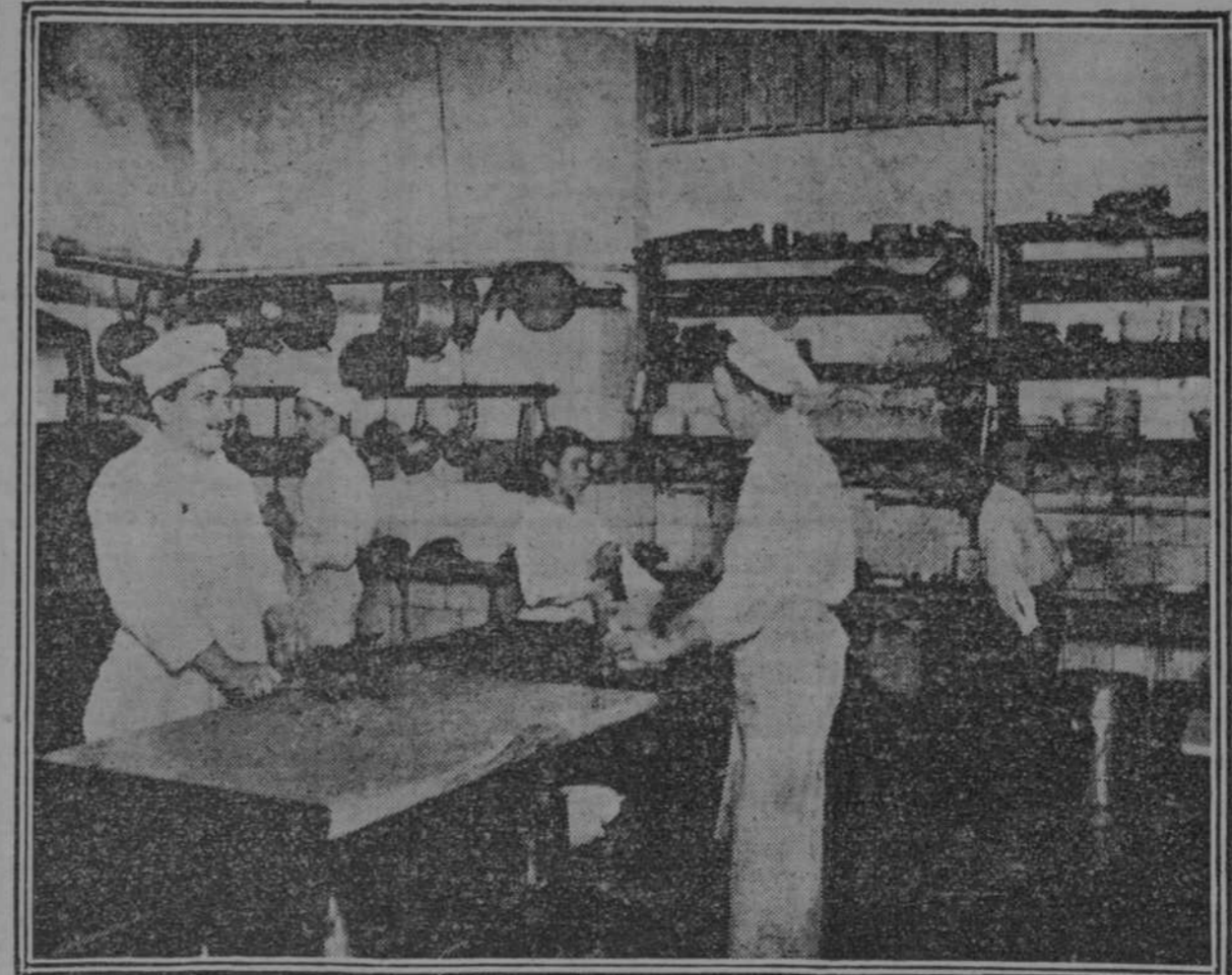
La cocina en plena actividad

bles, y es que no saben comer, y por lo tanto, no saben pedir... mire usted; hace tres noches un señor pidió "costillas a la papillote", y cuando el camarero se las presentó, ¿sabe usted por qué armó un escándalo? ¿Pues por que se las habían servido envueltas en el papel que precisamente es lo característico del plato! Crea usted que hay cada tipo... No saben qué es cocina de altura y cuando pi-