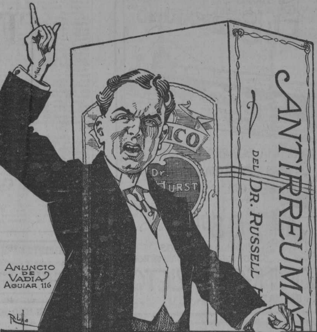
ANUNCIO DE VADIA AGUIAR 116