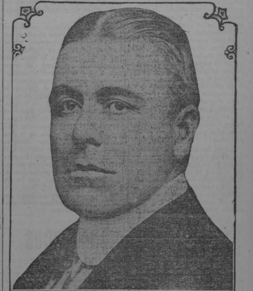
Candidato a Gobernador, en el Estado de New York, por el Partido Democrático; y quien, a juzgar por los "avances electorales" de las primarias, está siendo derrotado por el candidato de los Republicanos Mr. Whitman. Los progresistas, haciendo bueno los compromisos de su jefe, Mr. Roosevelt, han apoyado a Mr. Whitman.

LOS DEMOCRATAS DERROTADOS EN NEW YORK MR. SAMUEL SEABURY