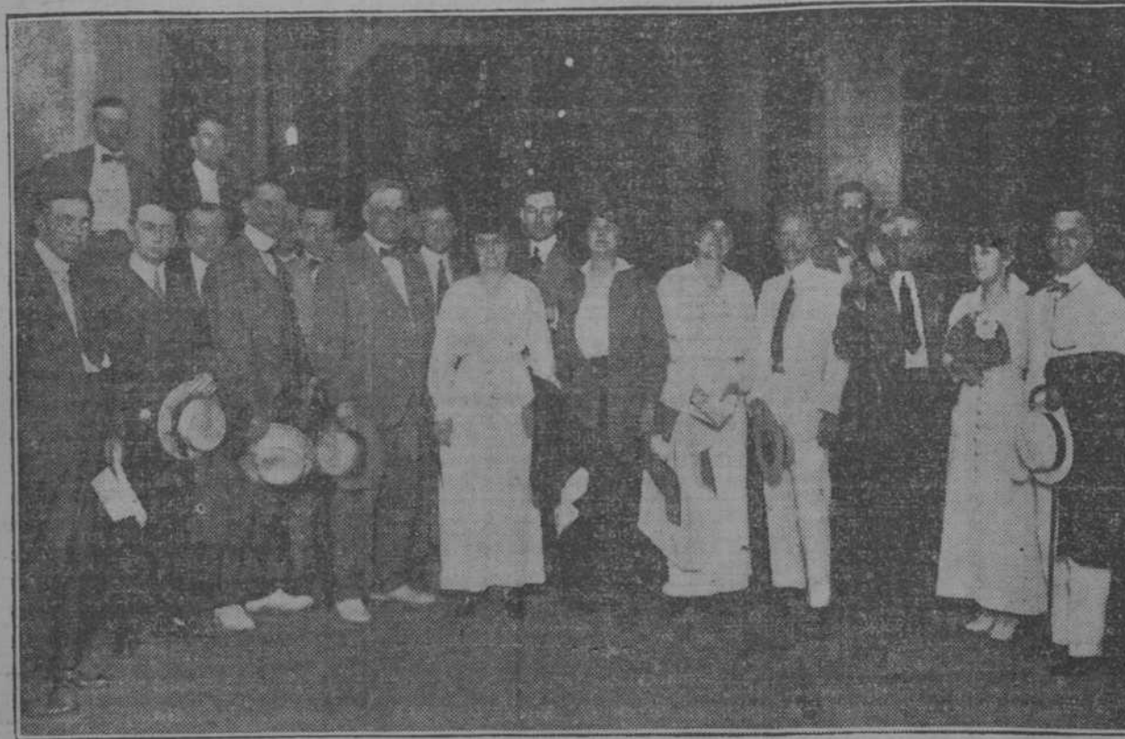
Los periodistas financieros americanos al desembarcar anoche por la Casilla de Pasajeros de la Aduana.

Quedaron muy complacidos del recibimiento.