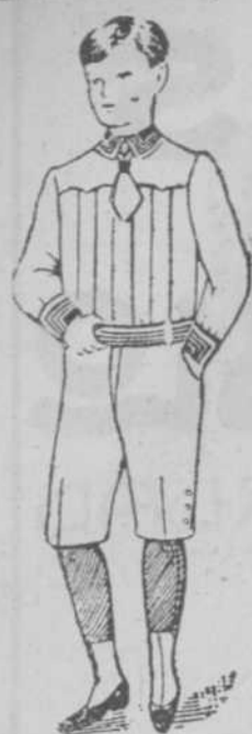
Traje corte francés, $3-00