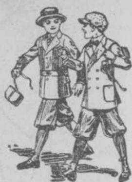
Traje Americana, en blanco, $3-50. en color $2-00

Por fin llegó el inmenso surtido de trajes para niño, propios para la estación, en blanco y color. Especialidad en ropa interior para señora y niña.