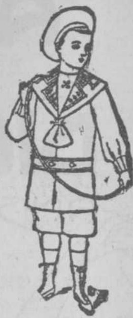
Ruso blanco, $2-80.