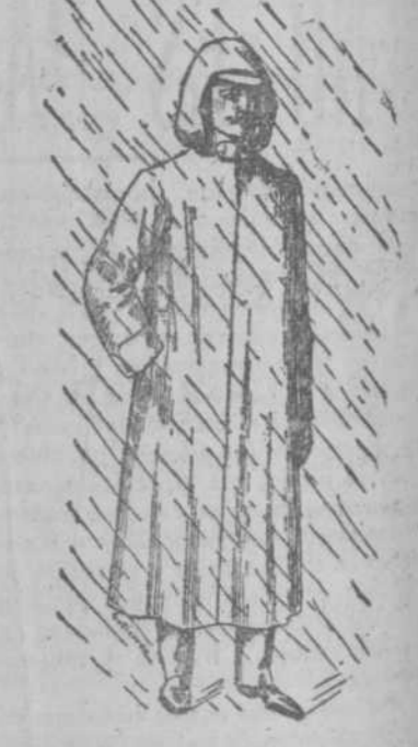
Propios para andar a pie