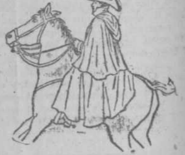
Con vuelo extra, para montar a caballo.

Extenso surtido en las dos clases. PRECIOS MODICOS. PELETERIA. "LA MARINA DE LUZ" PORTALES DE LUZ. TELEFONO A-1430