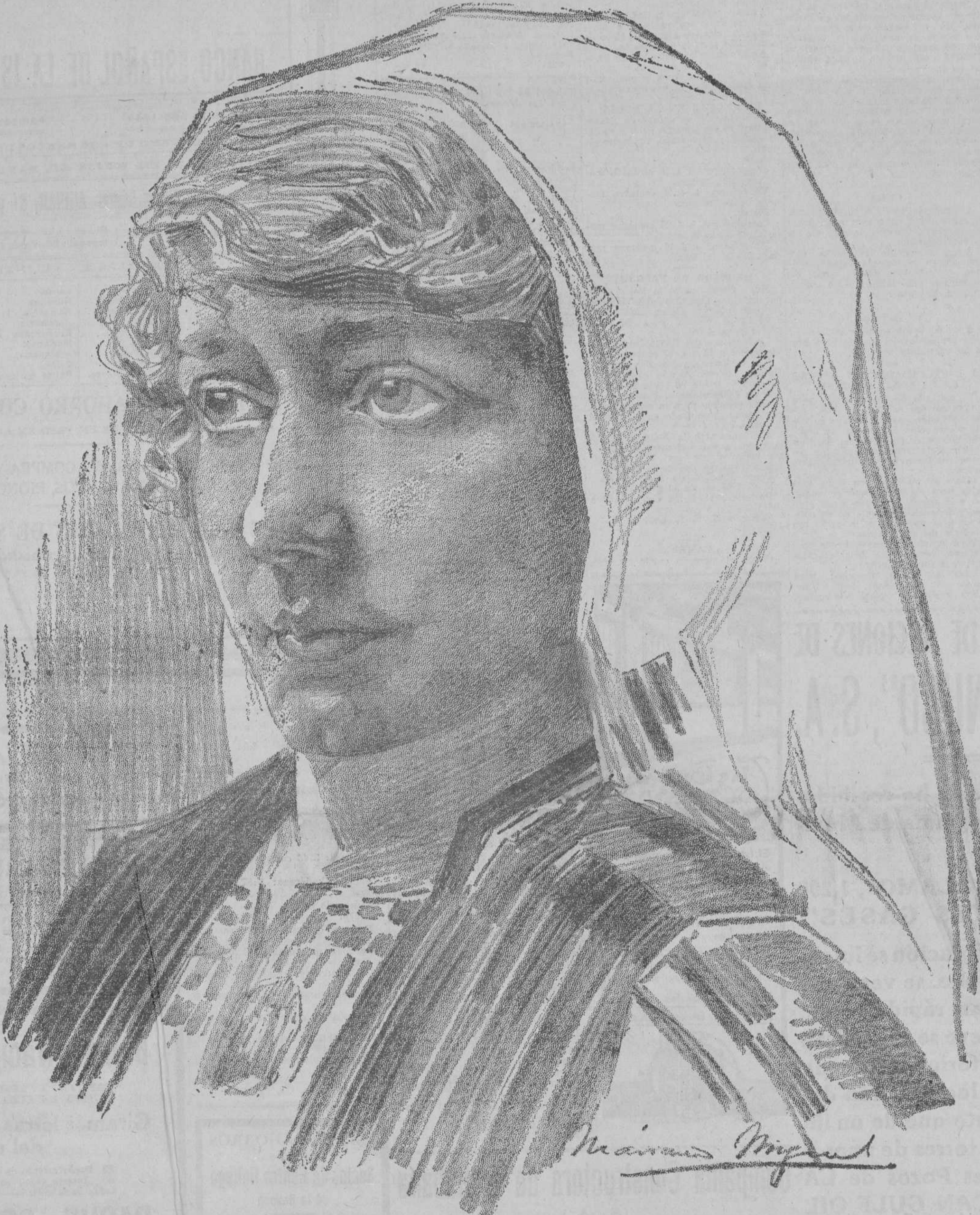
TIPO DE MACEDONIA

Marzo 25 CACION DEL EVENING SUN Acciones 245.100 DROS 1.630.000 CLEARING HOUSE Las cheques cancelados ayer en el "Clearing House" de New York, según el "Evening Sun", $408.919.216