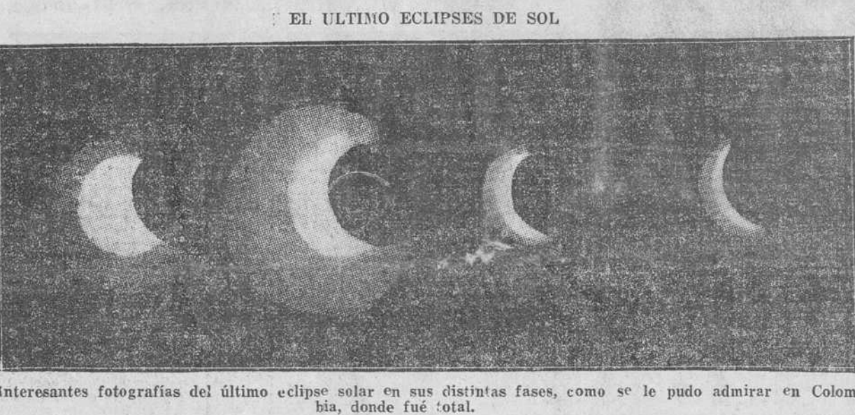
Interesantes fotografías del último eclipse solar en sus distintas fases, como se le pudo admirar en Colombia, donde fué total.

de tanto aparato, y tan costoso, y de influencia tan mínima? —A los Estados el mejor cada uno su sistema de enseñanza, el ensanchar el campo de acción de sus maestros. Y ya algo se está haciendo en las distintas entidades federativas. —En Sonora, por ejemplo, se les están pagando a los maestros sueldos que varían de 1.000 a 4.000 pesos mensuales... —"Pesos papel, observa el repórter." —"Sí señor, papel, pero hay que considerar que el sueldo oficial de los ministros es de tres mil pesos al mes... Salta a la vista la nueva PASA A LA PAGINA DOS