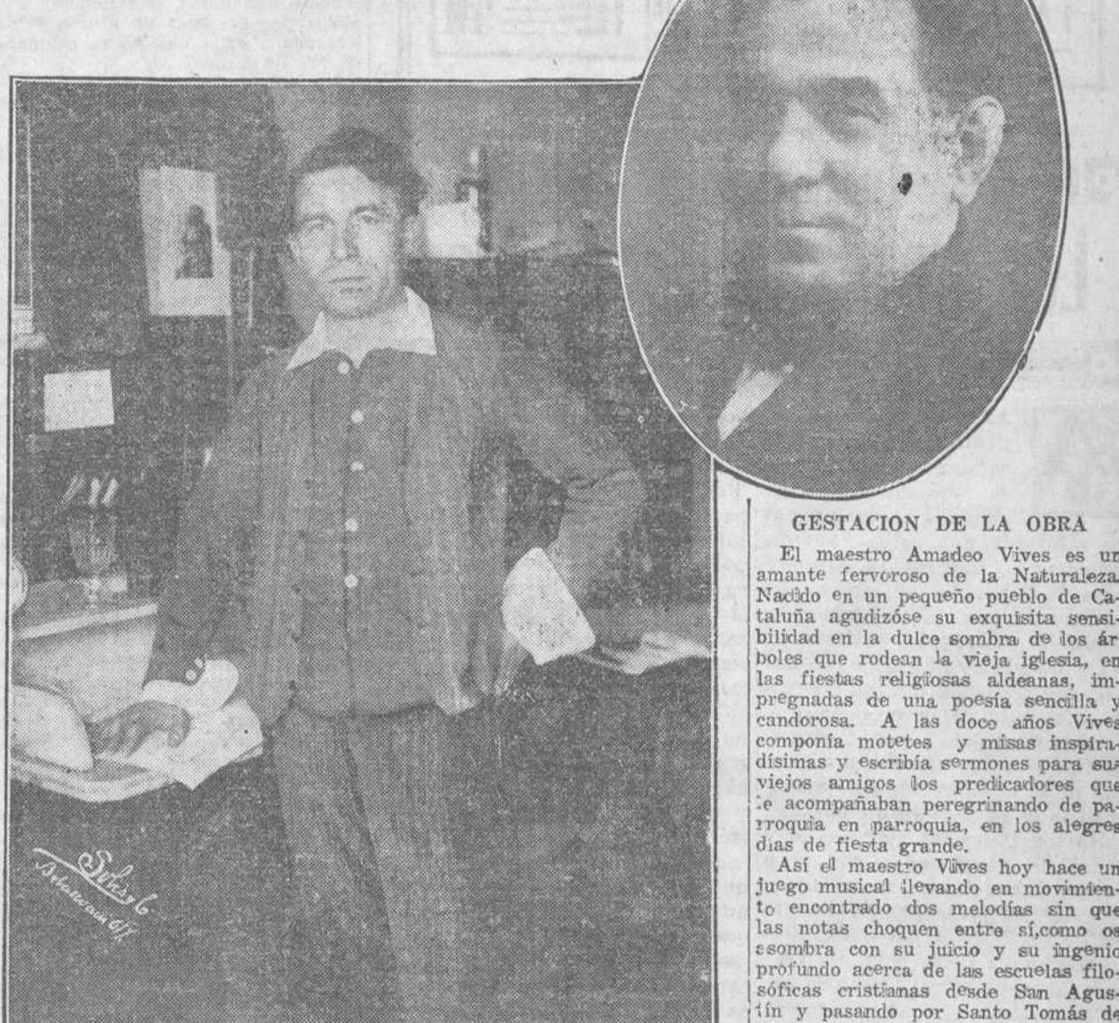
GESTACION DE LA OBRA