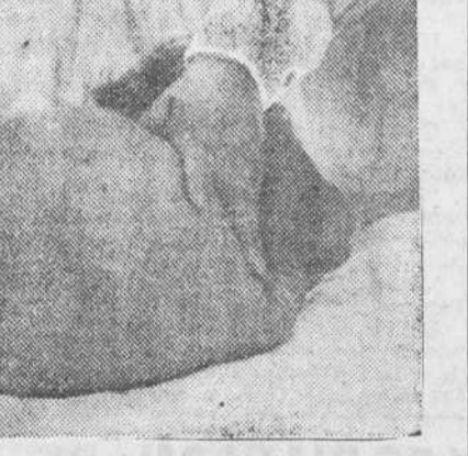
AGUJA PARA LA PUNCION