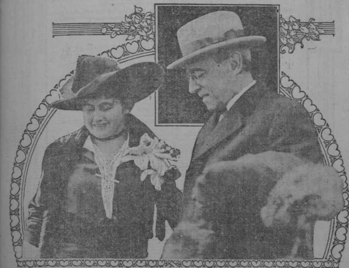
MR. WILSON, PRESIDENTE DE LOS ESTADOS UNIDOS, Y SU NOVIA, MRS. GALT, CUYA BODA SE CELEBRARA HOY.