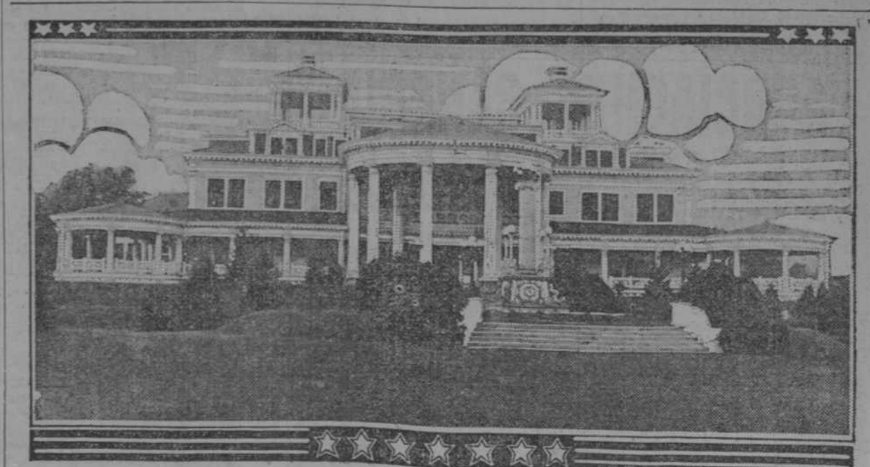
SHADOW LAW, FINCA QUE PERTENECIO AL DIFUNTO JOHN A. MCCALL, EN ELBERN, NEW JEN SEY, ESCOGIDA POR EL PRESIDENTE WILSON PARA SU RESIDENCIA DURANTE EL VERANO DESPUES DE QUE PASEN ESTOS PRIMEROS MESES DE LUNA DE MIEL.