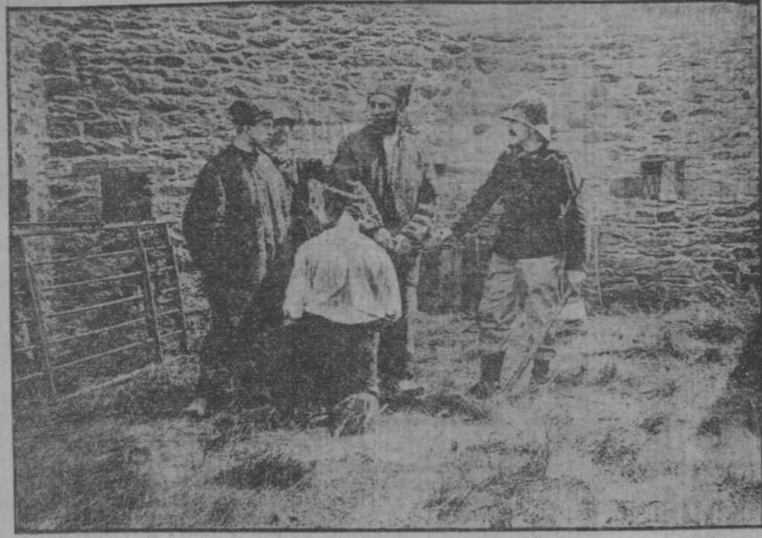
Una escena de la película de Santos y Artigas titulada "La Evasión de Rocambole," que se estrena hoy por Santos y Artigas.

La película más interesante, más sensacional de las AVENTURAS DE ROCAMBOLE.-La 5a. serie.