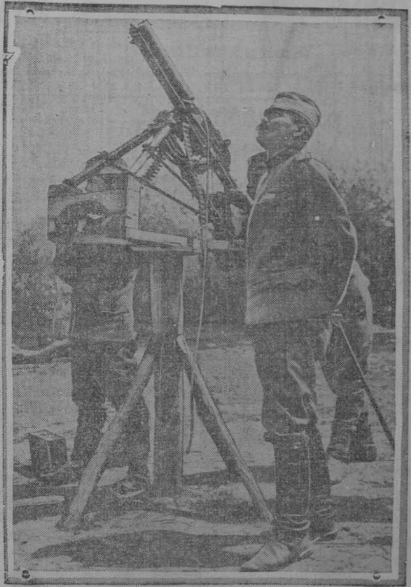
Por las noticias recibidas, los serbios están haciendo una fuerte resistencia a los ataques de los búlgaros y turcos. El grabado que aquí damos, muestra un cañón contra aeroplanos el cual ha sido colocado en Uskub, la famosa fortaleza capturada por los búlgaros y recapturada por los serbios.

LA RESISTENCIA DE LOS SERBIOS Belgrado, 6. Los serbios están haciendo una fuerte resistencia a los ataques de los búlgaros y turcos. El grabado que aquí damos, muestra un cañón contra aeroplanos el cual ha sido colocado en Uskub, la famosa fortaleza capturada por los búlgaros y recapturada por los serbios.