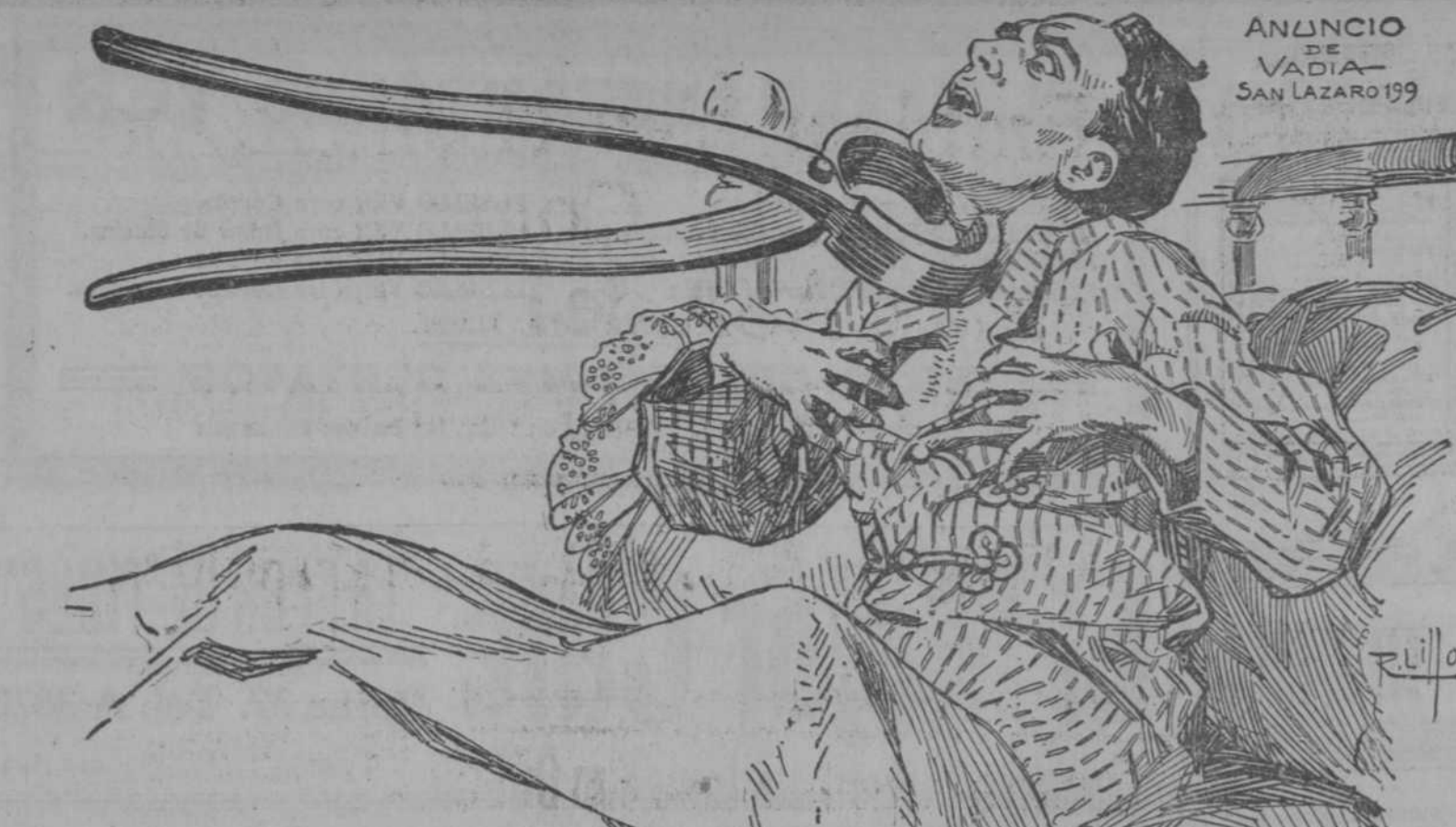
ANUNCIO DE VADIA-SAN LAZARO 199

Tan baratos como son ahora los periódicos, es una vergüenza no pagarlos.