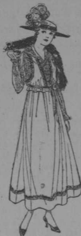
A Touch of Fur on the Frock McCall Pattern No. 657, one of the many new designs for November

Departamento de Confecciones de EL ENCANTO SOLIS, HNO. Y Cia. GALIANO Y SAN RAFAEL