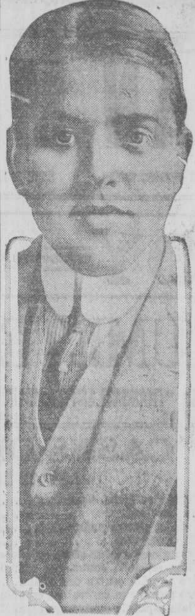
—Willic Hoppe, el Campeón Mundial Biliarista, que rompió el record mundial haciendo 317 carambolas en el "primer tiro," en un match celebrado contra Koji Yamada en Karlford, Conn.