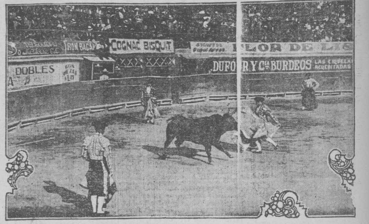
Un decreto presidencial de Carranza, recién electo Presidente de Méjico, acaba de suprimir las corridas de toros en Méjico.