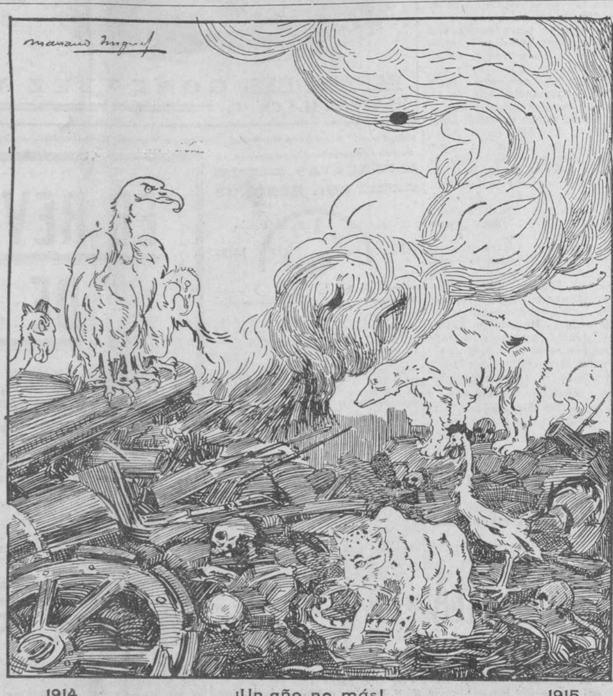
1914 [Un año no más] 1915