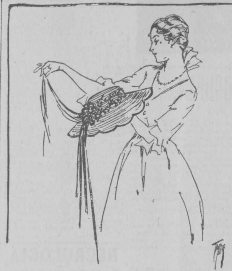
Aunque en la moda usual en sombreros predominan los pequeños, abundan también, los que, imitando modelos antiguos, son, como los de este modelo, un complemento de las nuevas "hechuras" en trajes; los cuales parecen recordados de las viejas fotografías.

—Basta, amigos míos, vámonos!—dijo Gilberto al cabo de breves segundos. Volveré a buscar este feroz rostro esta noche... Quiero reconocer el cadáver que envuerti, quiero hacermelo dueño de la clave de este enigmas misterioso y siniestro, pero hasta que llego la noche, nadie debe sospechar nuestro descubrimiento. Uniendo la acción a la palabra el doctor empezó a cubrir el foso empujando la tierra con sus manos.