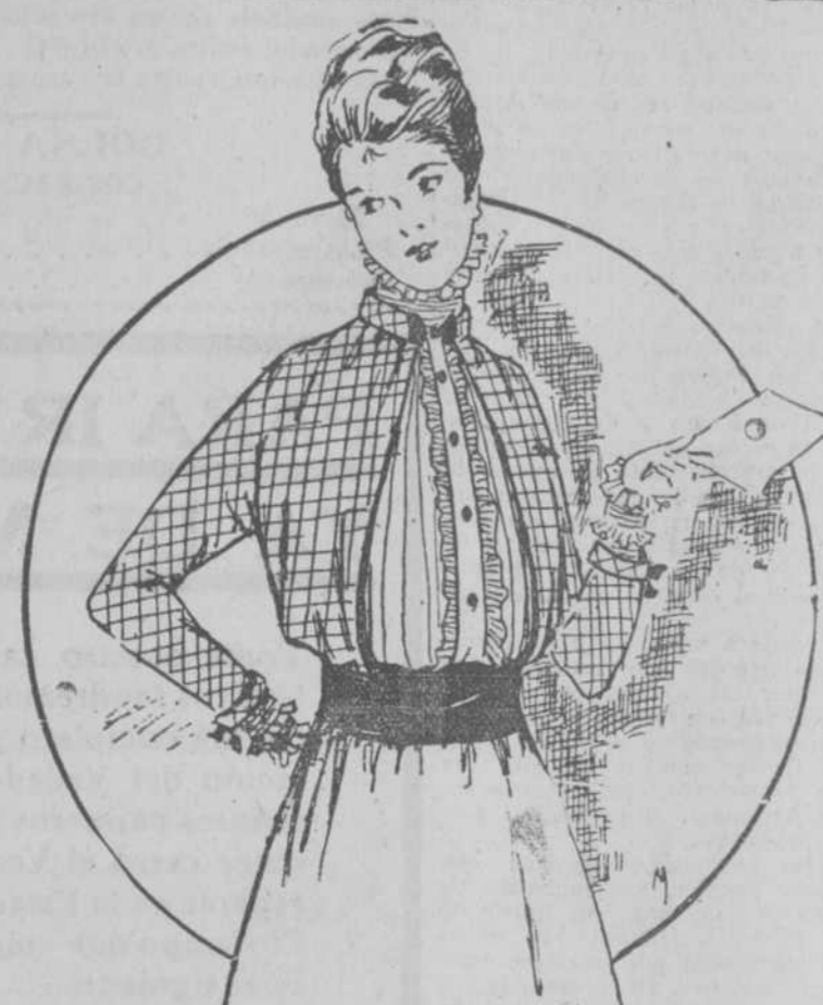
Las blusas con un doble cuello, según "marca" esta que aquí exhibimos, están siendo objeto de una especial dedicación de los modistos; los "puños" de esta "toilette" son, como puede observarse, de una extraña originalidad.

La señorita de compañía POR JAVIER DE MONTEPIN