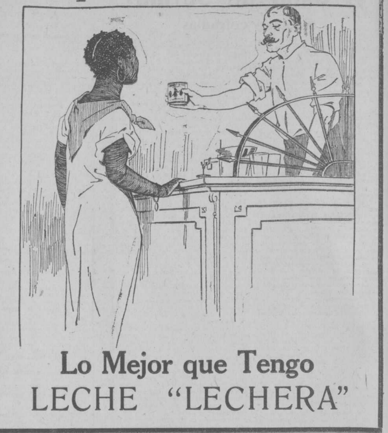
Lo Mejor que Tengo LECHE "LECHERA"