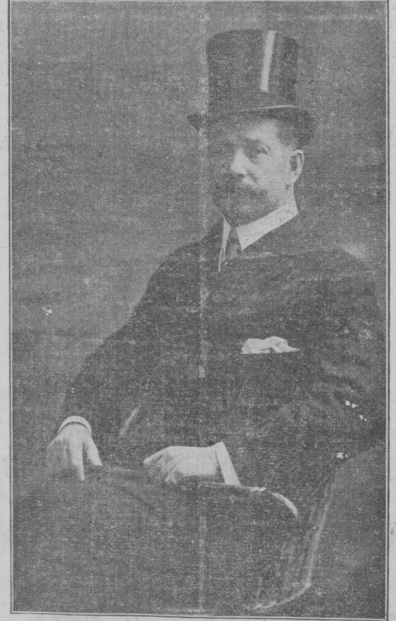
EL EXCMO. SR. D. JOSE CAÑO, Ministro Plenipotenciario de España en Méjico, a quien Carranza ha expulsado de aquella república, según información cablegráfica que hemos publicado esta mañana.

Las potencias neutrales, en general se han sometido a las medidas tomadas por el Gobierno Inglés, y especialmente no han logrado inducir al Gobierno Británico a devolver los súbditos alemanes y la propiedad alemana capturados en abierta violación del Derecho Internacional. En cierto modo hasta han secundado las medidas inglesas, que son incompatibles con el principio de la libertad de los (PASA A LA CINCO)