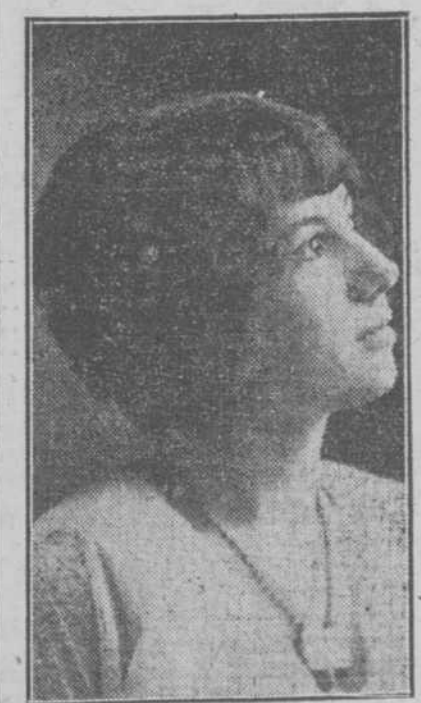
AMOR DE LOS RIOS. 1a. dama.

El último escrutinio en el Centro de Dependientes.—La Reina y las Damas de Honor.—El fomento al turismo.