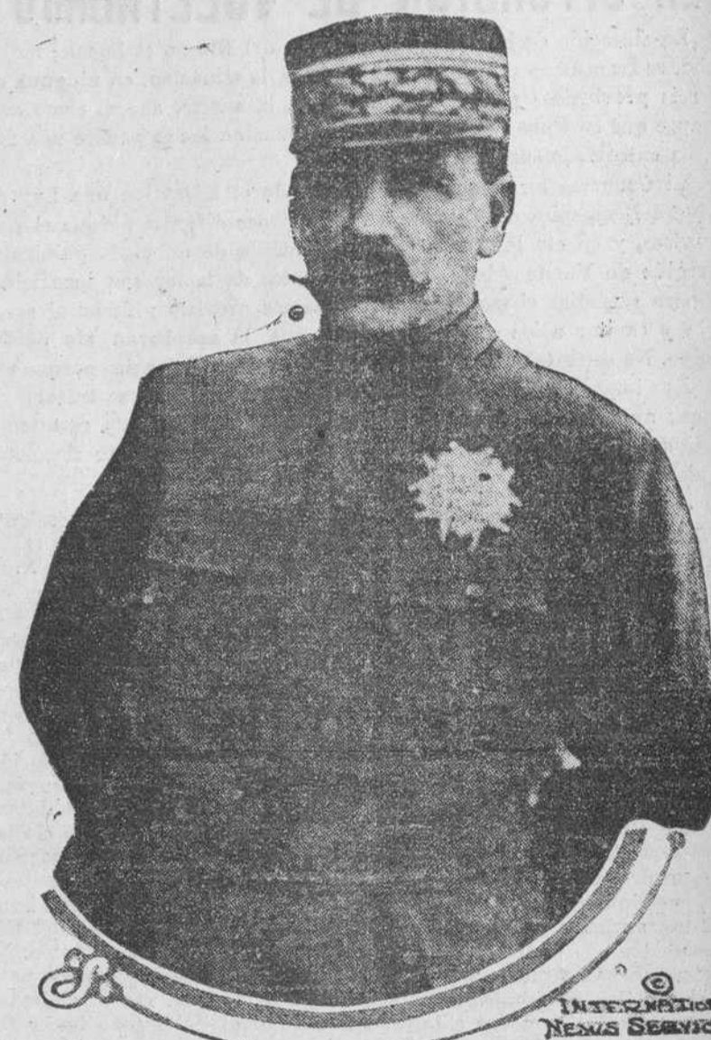
EL DEFENSOR DE VERDUN.—El General de Sarrail, comandante en jefe de las tropas francesas que, después de derrotar al Kromprinz de Prusia en la batalla de Vitri-le-Francois, avanzaron en socorro de la plaza de Verdun, impidiendo eficazmente que los alemanes los grasen asestar contra ella sus grandes baterías de sitio.

Por Decreto Presidencial, ha sido declarado de utilidad pública, la explotación del fosfato calizo existente en el Cayo del Estado denominado "Avalo" o "Calapatch," situado al Sur de la Isla y al Este de Isla de Pinos.