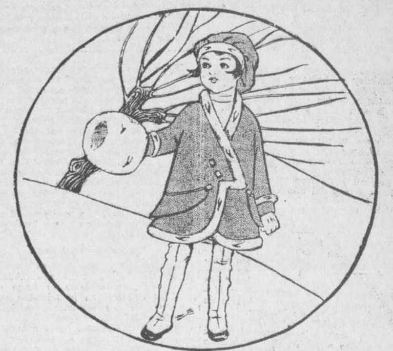
ABRIGO DE NISO—Es de lana gris, con piel blanca en el reborde. Igual combinación se usa en la gorra. (Mac Clure.)

bastaría sencillamente mezclar polvo de minio con las semillas. Puede hacerse la mezcla en un saco, en el que se echará un kilogramo de minio por cada veinte kilogramos de grano.