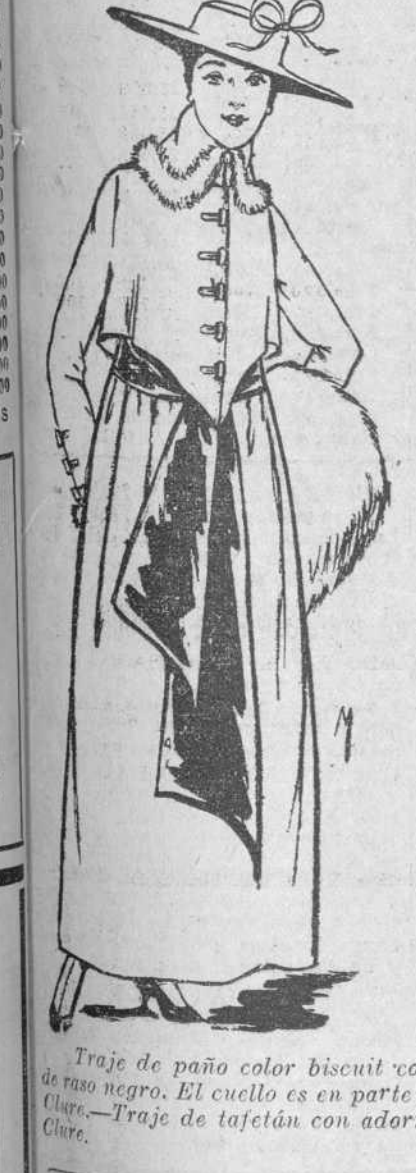
Traje de paño color biscuit con ceñidor, alado al frente. Ceñidor de raso negro. El cuello es en parte de tela y en los bordes, de piel.—Mc. Clure.—Traje de tafetán con adornos de rosas, bordadas en plata.—Mc. Clure.

El Poeta ha de ser hombre altanero. ¡Huelga la lira, cese al fin la mofa! Hay que ser en la vida, caballero, para ser caballero de la Estrofa. En la derrota, imperturbable y mudo, caer después de la fatal jornada, aprisionado el reluciente escudo y enarbolando con valor la espada.