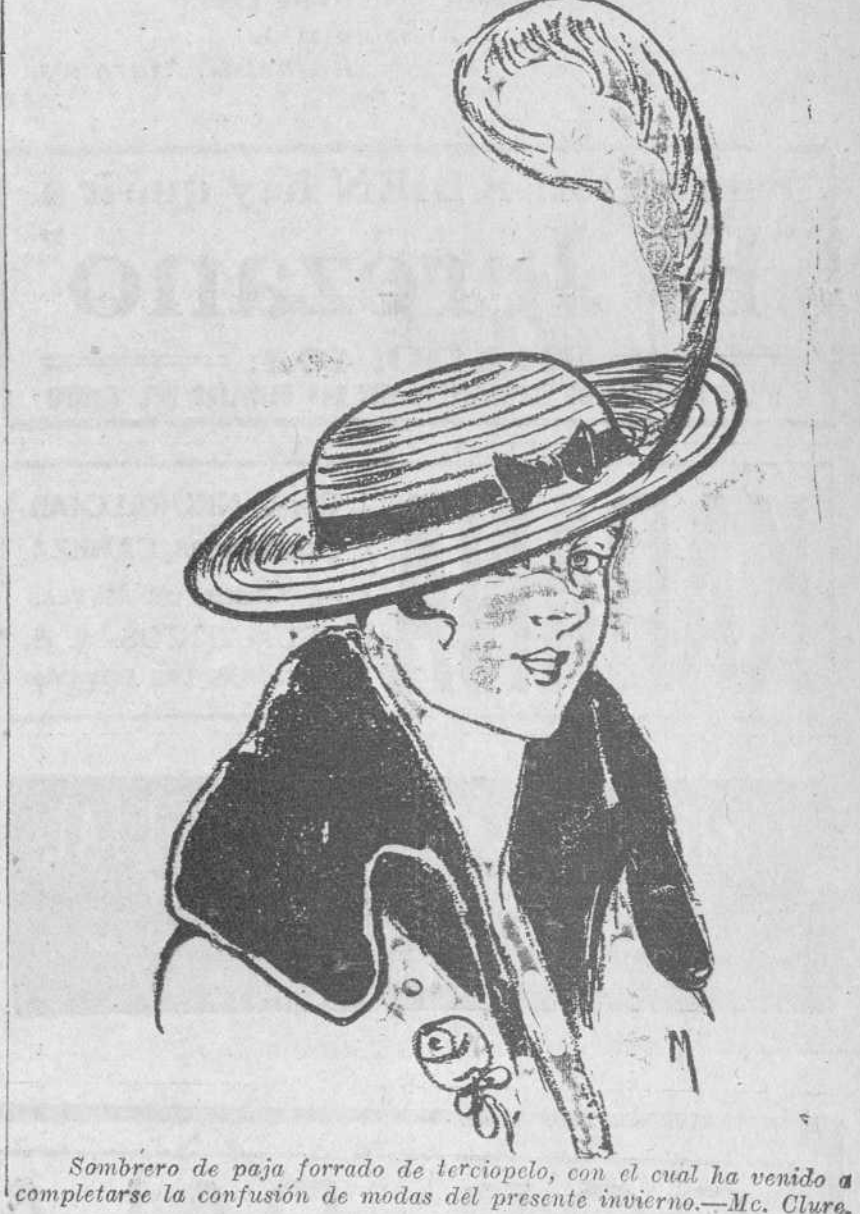
Sombrero de paja forrado de terciopelo, con el cual ha venido a completarse la confusión de modas del presente invierno.

¡Bélgica augusta! De mi pobre lira Notas amantes arrancar quisiera Para cantarte de loor y gloria Eterno canto. Nación sublime de heroísmo templo, Moderna raza de grandiosa historia, Sol de nobleza, de valor emblema, De ciencia emporio.