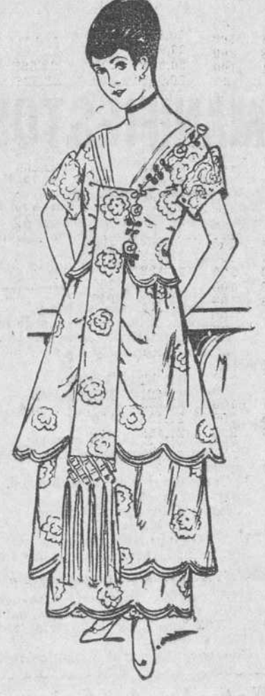
Traje de tafetán con adornos de rosas, bordadas en plata.—Mc. Clure.