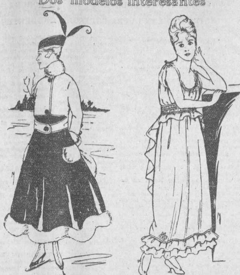
PRIMER MODELO.—Falda de terciopelo negro, reborde de piel blanca. Chaqueta de paño blanco, con puños y cuellos de blanca piel. MODEL OSEGUNDO.—Traje de seda; falda amarilla-crema; corpiño rojo oscuro. AMC. CLURE