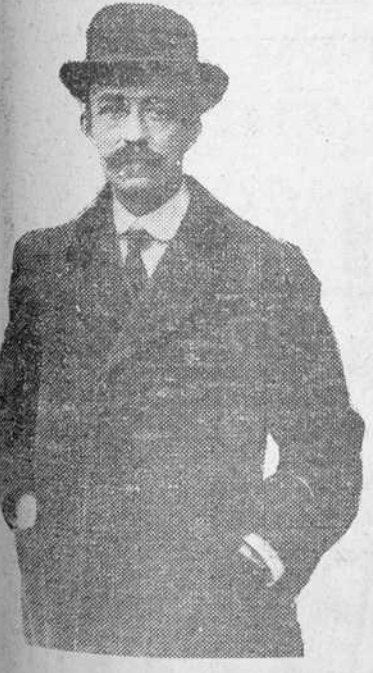
MANUEL DE FALLA