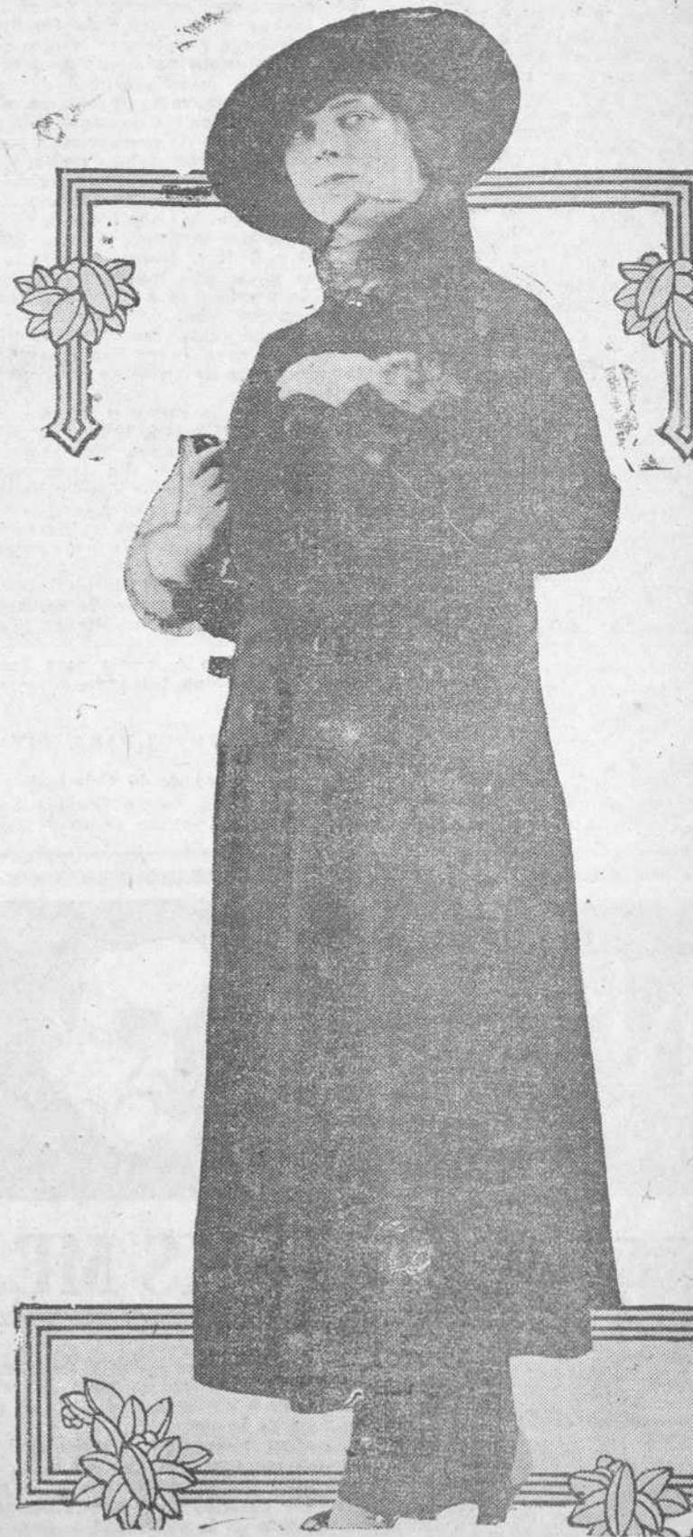
Este modelo es de "muyie" verde, con la inevitable piel, en las mangas y cuello. En el traje, como puede observarse, predomina la "orientación militar." (American Press Association.)

May Wilmoth. (Modelos American Press Association)