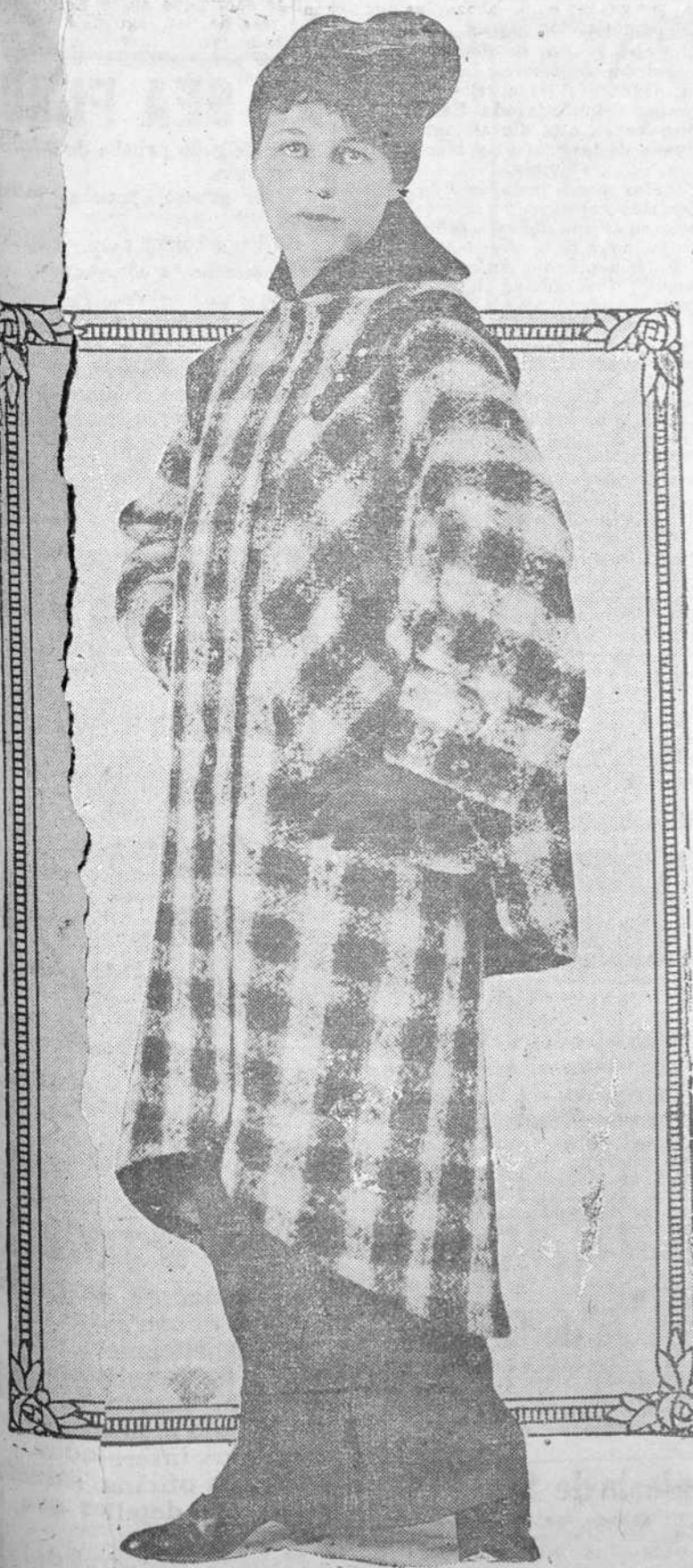
Gruesa casaca, a cuadros castaños y blancos. Cuello de terciopelo verde. Es un abrigo para ejercicios de "sport."