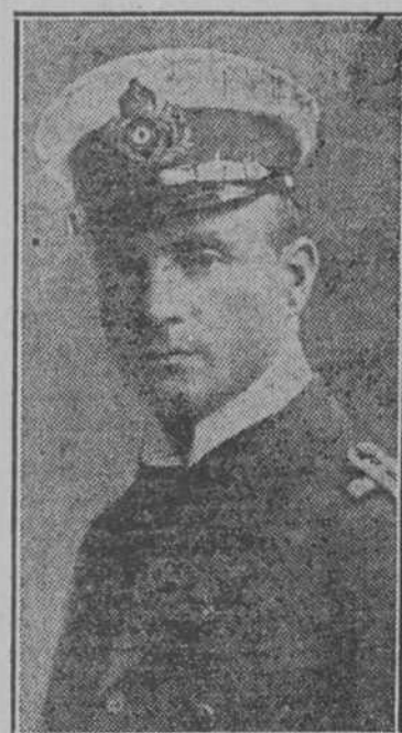
El Comandante del submarino alemán "U 9" que echó a pique 3 cruceros ingleses.

Viene de la primera misma violencia y encarnizamiento, sin que los alemanes hayan podido hacer retroceder a los aliados.