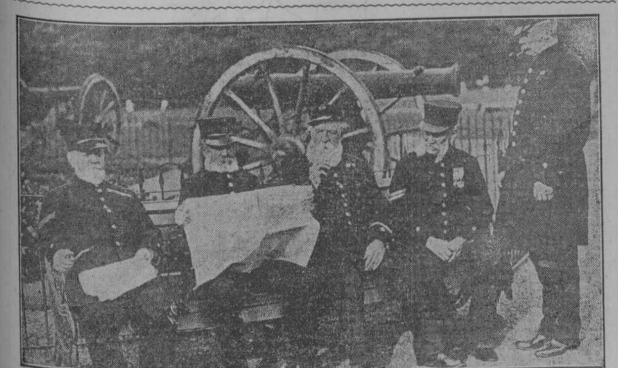
Los soldados veteranos ingleses leen los diarios con pasión.—Inválidos, que montan la guardia de honor en la Torre de Londres, donde se encuentra el museo del Ejército. Han combatido en Crimea, en 1854. Conociéron al Generalísimo French, de subteniente.

dirección de la humana actividad en todos los órdenes del trabajo. ¿De quién pues, ha sido la sorpresa? Cuando las personas se encumbran con méritos más o menos legítimos y se duermen sobre las vanidades que despierta un continuo halago, la resultante, con matemática exactitud, suele ser un terrible desengaño. Y esto mismo, con muy poca diferencia, sucede a los pueblos que se creen superiores y miran con desdén a cuanto queda fuera de la periferia que indica la frontera privilegiada de su país. Y es que la soberbia, en casos especiales, lejos de ser un mal, sirve de dolorosas enseñanzas a quienes se engrían sin motivo y se hinchaban como un globo a merced de las expansiones del orgullo. Pero volvamos al efecto brutal de estos maravillosos morteros alemanes, de los cuales, dice un periódico de Berlín: "En la toma de Lieja y Namur se han dado a conocer por el ejército alemán los nuevos y terribles morteros de 42 centímetros, que son de gran alcance y lanzan proyectiles de 500 kilogramos de peso. (Continúa en la plana 3a.)