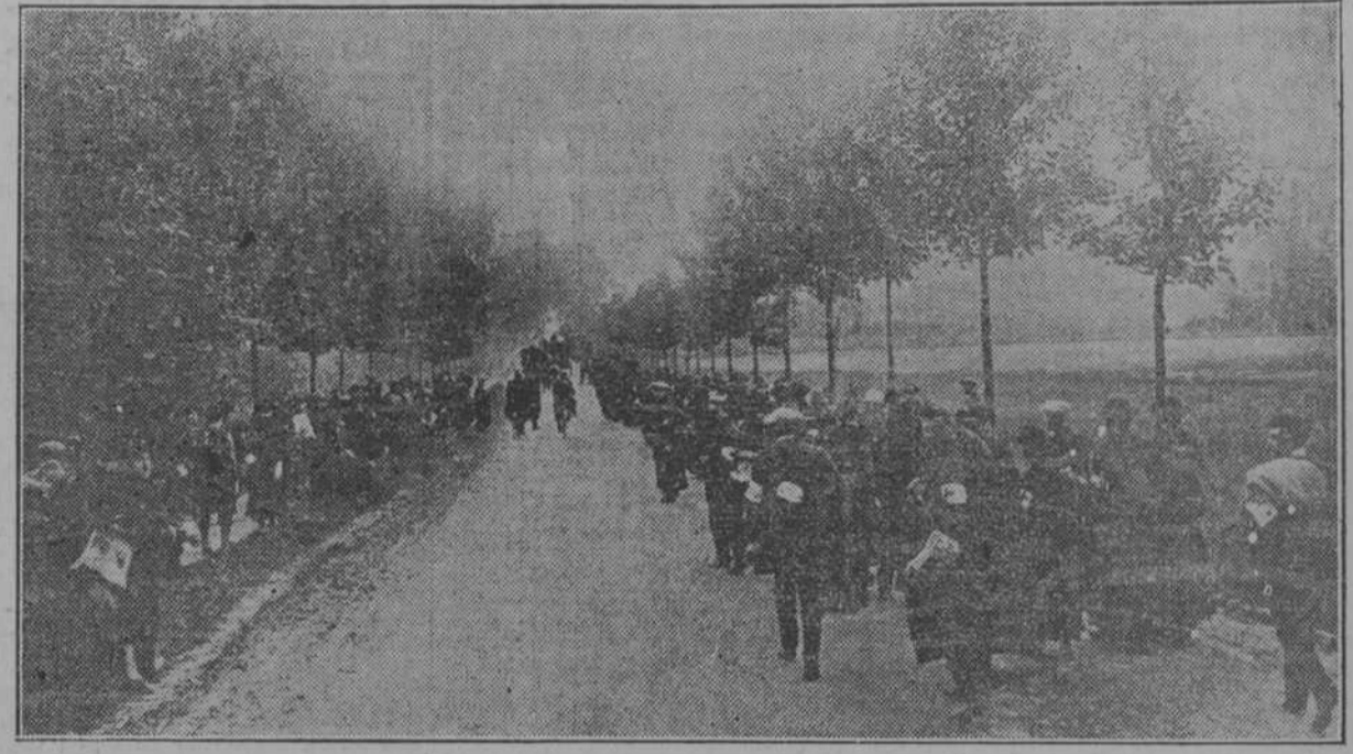
Una emocionante escena del exodo de la población civil belga por las carreteras del país invadido.