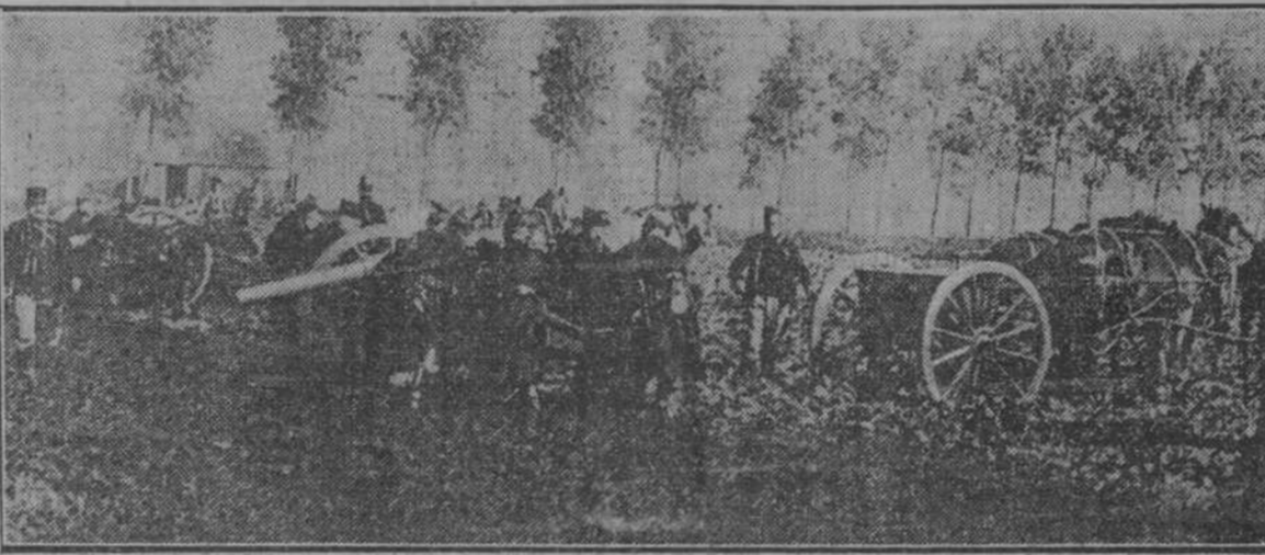
Artillería belga ocupando posiciones avanzadas cerca de Amberes.