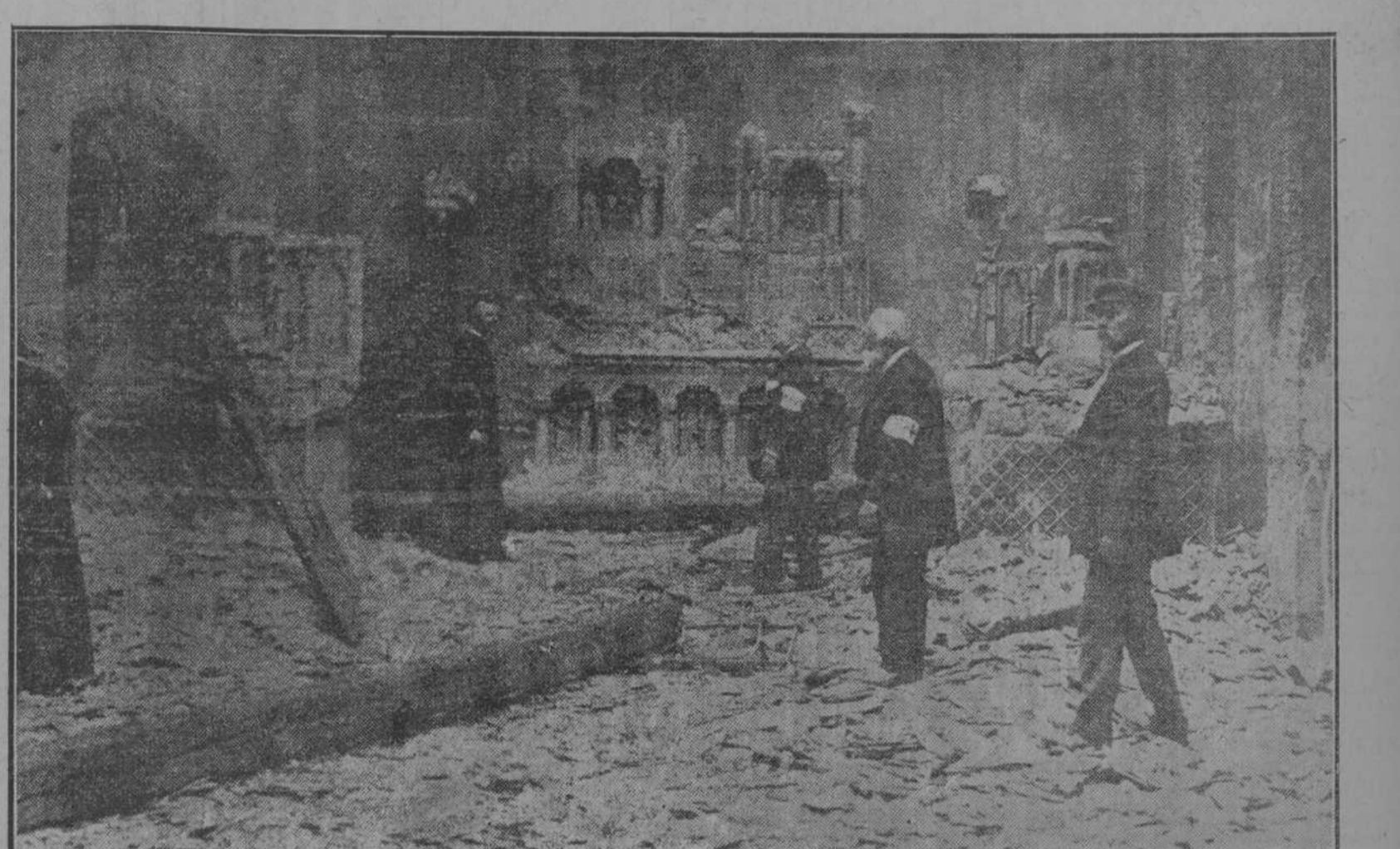
Sacerdotes y miembros de la Cruz Roja, inspeccionando las ruinas de una iglesia de Melle (Bélgica) después de evacuar la ciudad los alemanes.

DICEN EN LONDRES QUE LA LUCHA SERA LARGA Y TERRIBLE, CREYENDOSE QUE, AUN CUANDO SE ROMPA LA LINEA DE BATALLA, LAS FUERZAS INVASORAS OCUPARAN OTRAS TRINCHERAS IGUALMENTE FUERTES