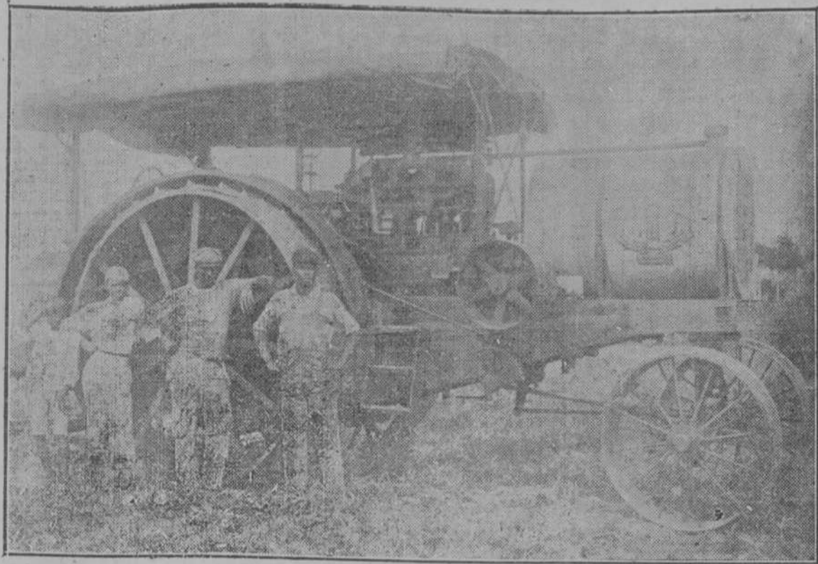
Máquina de arar, de 40 H. P. capaz para mover 12 arados, empleada en la Colonia "Santa Sofia," Isabel, con éxito.