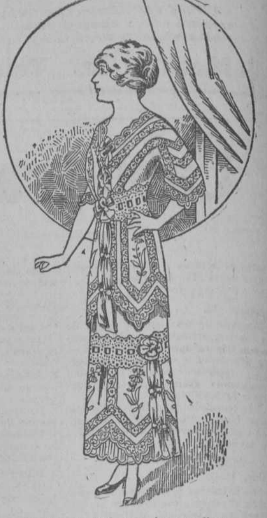
A. 62.—Matiné muy rico con finos entredos y adornos de nansú bordado. A $4.98.

Sábanas con dobladillo de ojo a 98 centavos.