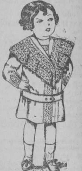
K. 134.—Rico abrigo de pluma con fina guarnición. Para 2 años, $3.60. Para 4 años $3.98.

Abierto los sábados hasta las 10 de la noche. Los Tranvías pasan por Delante de Estos Almacenes