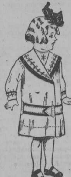
Batica de Warandol para niña de 2 años, a $1.00.