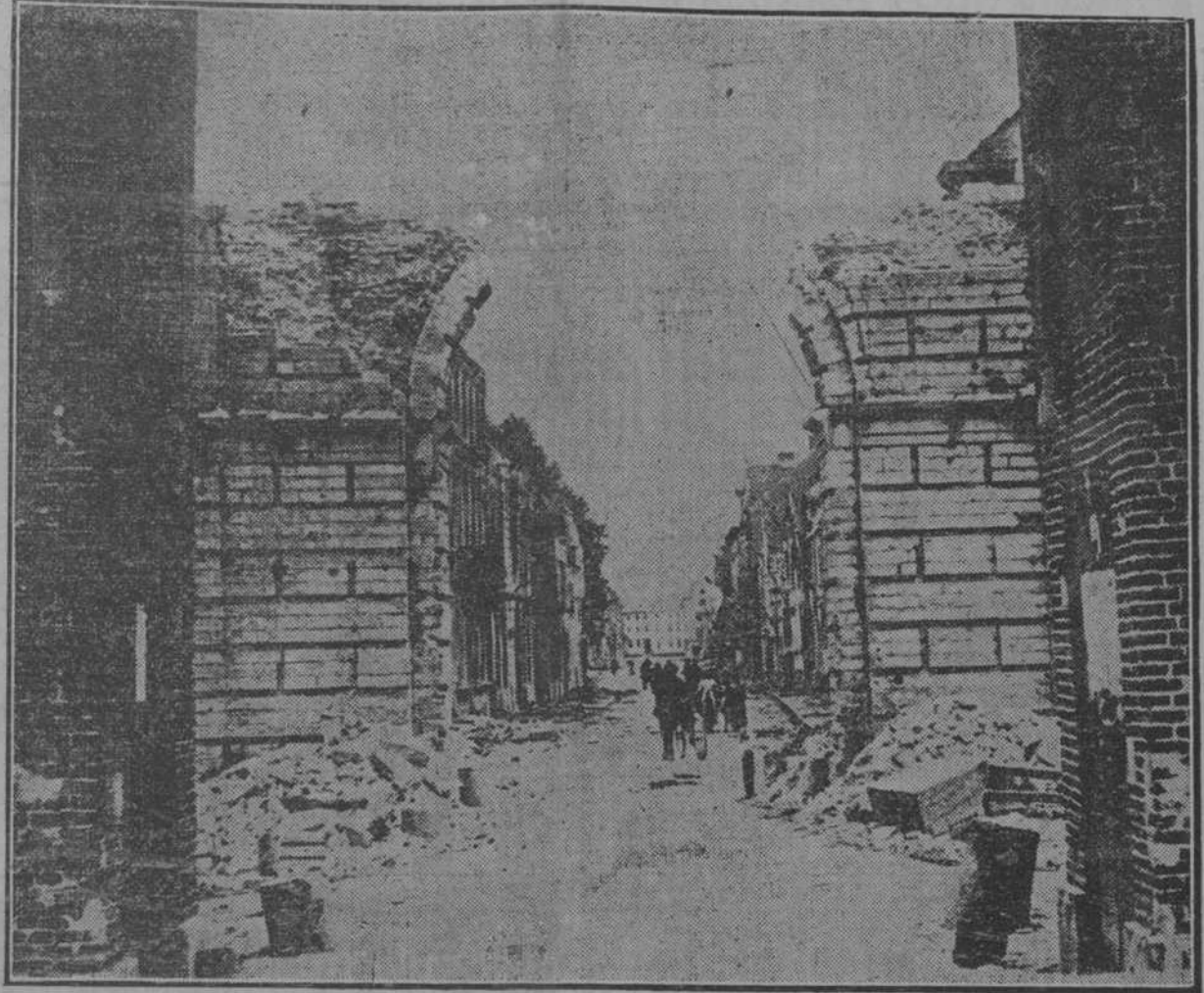
RUINAS DE UNA HERMOSA PUEBLO DE TERMONDE (BELGICA) DESTRUIDA POR LOS CAÑONES ALEMANES.

El periodista se ve precisado a advertirle todo, a imponerle todo, a acertarlo todo y a aventurarlo todo. Pero en los trenes ya es distinto. Con solo poner los pies en la Estación Terminal se sienten los políticos más locuaces. En ocasiones la noticia más fresca, la información más precisa, la impresión política más exacta la dan los laboriosos REPORTERS de la Estación Terminal. ¡Y como trabajan! Al bajar del tren o al dirigirse al tren, ignoran que metamorfosis se producirá en el ánimo del político que generalmente se espantará. ¿Es que tendrá la opinión de que el hecho de tomar el tren significa un peligro, que se colocarse a dos pasos de la muerte, y se considerará obligado a decir la verdad como diz que se dice en la triste hora de la muerte? Abandonemos el estilo lígubre. He aquí la conversación interesante: —No lo dude usted, no lo dude usted, le decía un pasajero a otro, arrellenándose los dos en una de las localidades de los cómodos carros pullmans de la línea central de la isla— el general Menocal que está resultando un buen Presidente se verá obligado a ir a la reelección. —El no la desea, él no la aspira, él no la quiere. —Lo sé. Después del mes de Noviembre variará el tablero político como usted no tiene una idea. Primero: el general José Miguel Gómez se dirigirá a Washington a obtener la VENTANA electoral-presidencial, pues de otra manera él «no va al hate». Es (Continúa en la segunda plana)