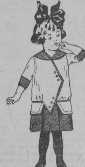
Vestido vichy, adorno escocés, para niñas de 2 a 8 años. Desde 98 centavos.