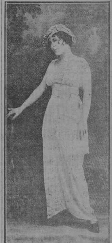
ULTIMO MODELO DE GRAN NOVEDAD

—No, señor. Me estoy ensayando. Me dijo ayer mi hermana que si no tenía novio era porque no sabía echar el anzuelo.