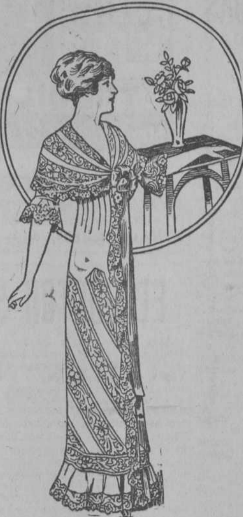
Elegante bata de nansú francés, adornada de finos encajes y entredos valencianos. En todas tallas: $5.98.

Teléfono A-2891. TENIENTE REY, 19, ESQUINA A CUBA. Apartado 1372. GRANDES REBAJAS DE PRECIOS