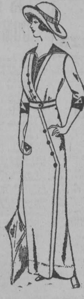
Elegante vestido de ratiné para señora, con adornos azul y punzó a $3.98.

Faldas con dobladillo de ojo, desde 25 centavos.